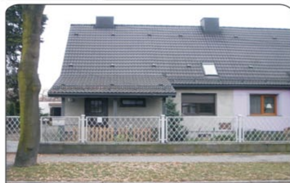
Gliwice Lubliniecka - do sprzedaży dom w zabudowie bliźniaczej położony w doskonałej dzielnicy Gliwic. Powierzchnia domu wynosi 120 mkw, działka - około 800 mkw. Nieruchomość w bardzo dobrym stanie technicznym, dach po wymianie. Dodatkowo garaż. Atrakcyjna cena: 570.000 zł. Polecamy!