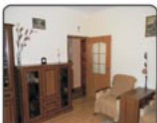
Zabrze De Gaullea - kawalerka po remoncie o pow. 35,5mkw. 1 piętro w bloku 3-piętrowym. Ogrzewanie centralne. Cena: 118.000 zł