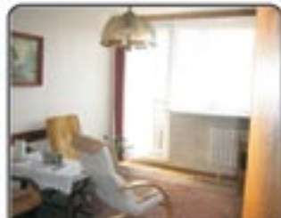
Zabrze ul. Nad Kanalem - 2 pokojowe mieszkanie o pow. 47,33m, 6 piętro, bardzo ładny układ mieszkania. Cena: 160.000zł