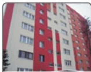
Zabrze Franciszkańska - mieszkanie 2 pokojowe na 11 piętrze. Po remoncie. Powierzchnia 49,20 m 2 . Pokój z balkonem. CENA 112.500 zł