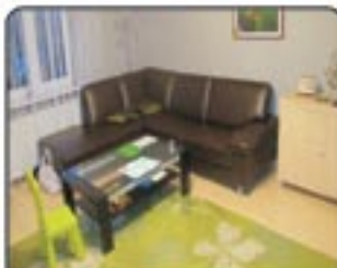
Gliwice, Lipowa - komfortowe mieszkanie 3-pokojowe, o powierzchni 68,5 m 2 , w kamienicy. Ogrzewanie - piec gazowy 2-funkcyjny. Świetna lokalizacja. Cena: 335.000 zł