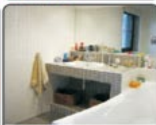
Zabrze okolice Stadionu . Dom wolnostojący o powierzchni 160 mkw Działka 451 mkw. Rok budowy 1990. Proponowana cena: 550.000 zł