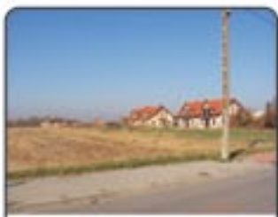
Zabrze Grzybowice Ul. Hallera - Przy Ujęciu. Działki budowlane 6 szt od 904m 2 do 911m 2 . Szer.22m. Cena 180 zł/m 2