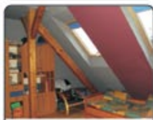
Zabrze Mikulczyce - 3 pokoje mieszkanie 2 poziomowe. Pow. 70 m 2 , dodatkowo ogródek 100 m 2 - dzierżawa. Stan dobry. Cena 200.000 zł