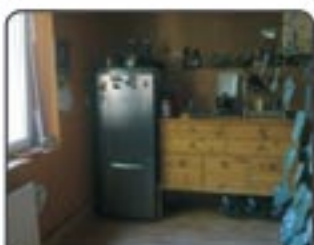
Gliwice ul. Płowiecka - 2 pokojowe mieszkanie z ogrodem. Pow. 40mkw. II piętro. Doskonała lokalizacja! Proponowana cena: 193.000zł