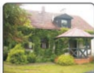
Żernica - dom wolnostojący o pow. 160 mkw, działka o pow. 1500mkw. Wszystkie media. Super lokalizacja. Cena: 630.000 zł