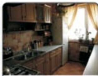
Gliwice, ul. Paderewskiego - Do sprzedaży ładne, 4-pokojowe mieszkanie o pow. 74mkw. Duży balkon. Proponowana cena: 270.000 zł