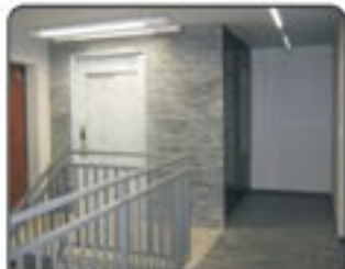
Gliwice - mieszkania 2 oraz 3-pokojowe w stanie deweloperskim na nowym osiedlu. Niskie budynki z windą, Wysoki standard wykończenia