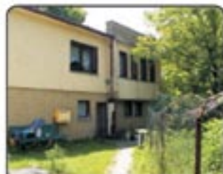
Zabrze Pawłów - parterowy dom wolnostojący. Powierzchnia użytkowa 90 mkw, działka 574 mkw. 3 pokoje, kuchnia, łazienka. Cena: 290.000 zł