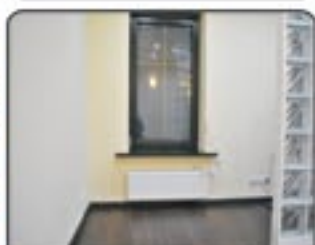
Gliwice Centrum - komfortowa kawalerka o pow. 26 mkw. Ogrzewanie gazowe i podłogowe. Cena: 120.000 zł