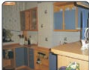
Zabrze ul. Cisowa - Mieszkanie 3 pokojowe na 2 piętrze po remoncie Pow.76 m 2 . Cena 219.000 zł