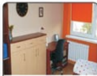
Gliwice Zubrzyckiego - 2 pokojowe mieszkanie, o powierzchni 39 mkw. Ogrzewanie z sieci. Mieszkanie z balkonem. Cena: 153.000 zł