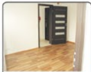
Zabrze ul. Reymonta - mieszkanie 2 pokojowe po kapitalnym remoncie. Powierzchnia 38 m 2 . Cena 130.000 zł