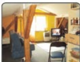
Zabrze Cmentarna - Kawałeczka po remoncie. Powierzchnia 71,95 m 2 . Drugie piętro. Kuchnia otwarta na salon. Ogrzewanie centralne. CENA 79.900 zł