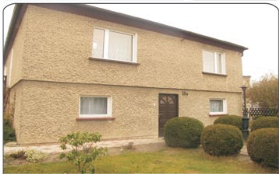
Wielowieś - do sprzedaży dom wolno stojący o powierzchni 100 mkw położony na działce 810 mkw. Dom składa się z dwóch kondygnacji, parteru i piętra. Ogrzewanie węglowe, okna plastikowe na podłogach kafe i panele. Cena sprzedaży: 370.000 zł Polecamy!