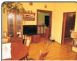
Gliwice Zwycięstwa - 3 pokojowe mieszkanie o pow. 47 mkw. Lokal i klatka po remoncie. C.o elektryczne. Cena: 199.000 zł