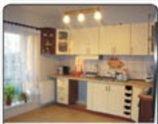
Knurów - do wynajęcia mieszkanie 3 pokojowe o pow. 70,38 mkw na zamkniętym osiedlu. Pełne umeblowanie i wyposażenie. Czynsz 1500 zł + media.