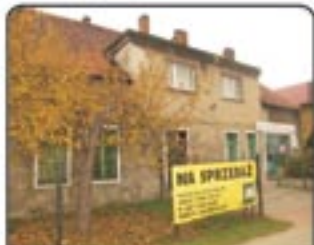
Żerniki - dom wolno stojący o pow. 252 mkw, wraz z piekarnią oraz przynależnym sklepem, działka 930 mkw. Cena: 449.000 zł