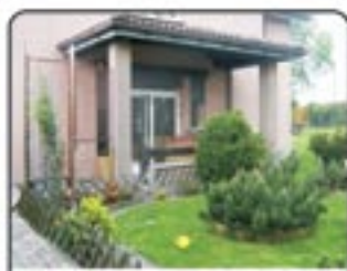
Gliwice - Bojków - dom wolno stojący o pow. 290mkw. Do zamieszkania i pod działalność gospodarczą. Sugerowana cena: 780.000 zł