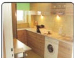
Zabrze Żółkiewskiego - Mieszkanie 3 pokojowe, wysoki parter. Pow.60 m 2 . Po remoncie. Stan tech. bardzo dobry. Ogrzewanie z sieci. Cena 190.000 zł.