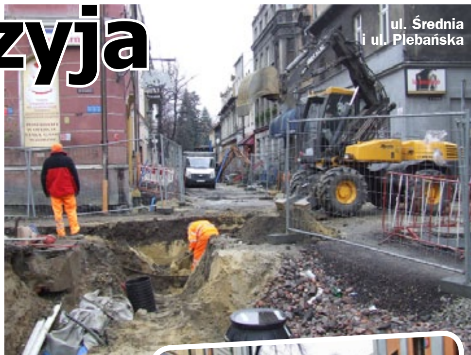
ul. Średnia i ul. Plebańska