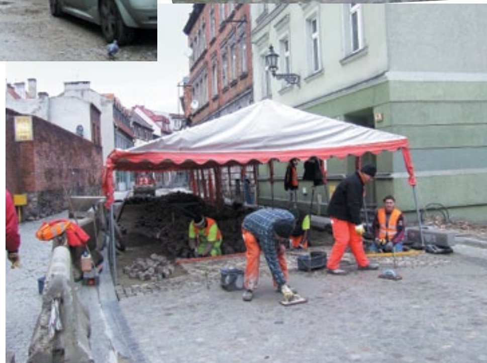
Jezdnia - kostka historyczna