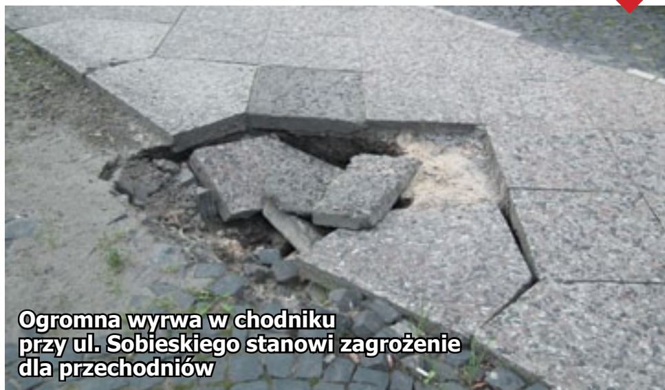
Ogromna wyrwa w chodniku przy ul. Sobieskiego stanowi zagrożenie dla przechodniów