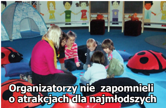
Organizatorzy nie zapomnieli o atrakcjach dla najmłodszych

Dzieci i młodzież mogą wziąć udział w specjalnych warsztatach organizowanych przez Centrum Edukacji Obywatelskiej. Wstęp na wystawę i warsztaty jest wolny. Kto jeszcze na niej nie był, musi się pospieszyć, bo można ją oglądać do końca lipca. Kolejnym przystankiem będzie Wrocław.