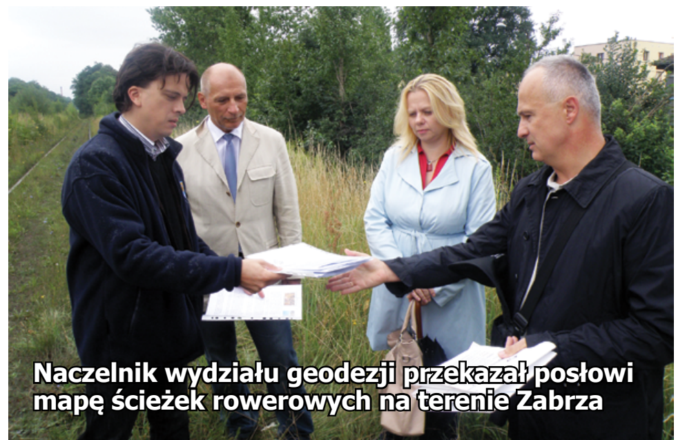
Naczelnik wydziału geodezji przekazał posłowi mapę ścieżek rowerowych na terenie Zabrza