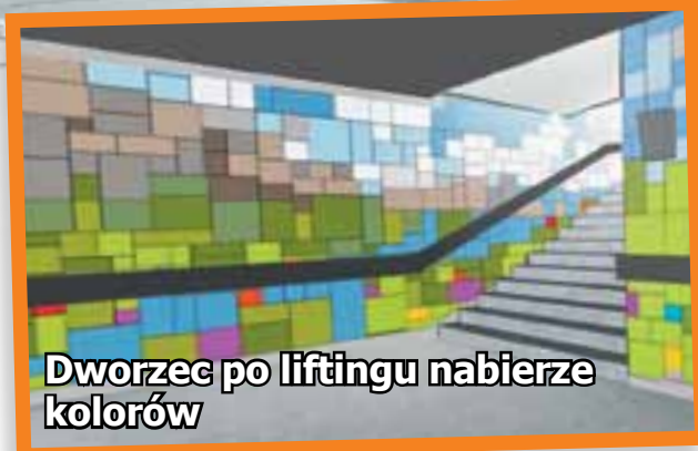
Dworzec po liftingu nabierze kolorów

Dzięki umowie, dworzec ma stać się nowo-