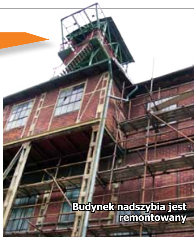
Budynek nadszybia jest remontowany

Była pompowana najpierw z poziomów: 340 metrów, 220 metrów oraz odwiertu z wykonanego z cegły półmetrowego szybu o średnicy 4,30 metra, przechodzącym przez złoża wodonośne wody pitnej. - Kiedyś, gdy jeszcze szyb normalnie funkcjonował, woda