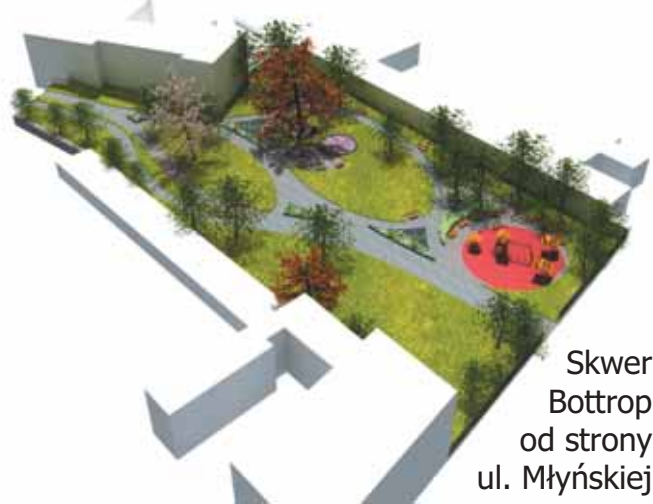
Skwer Bottrop od strony ul. Młyńskiej

Najmniejsze zmiany przewidziano na Placu Mickiewicza. Pojawią się jedynie nowe trawniki i przybędzie ławek. To ulu-