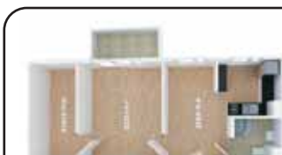
Dodatkowo - uzdatniacz wody. Ogrzewanie miejskie.