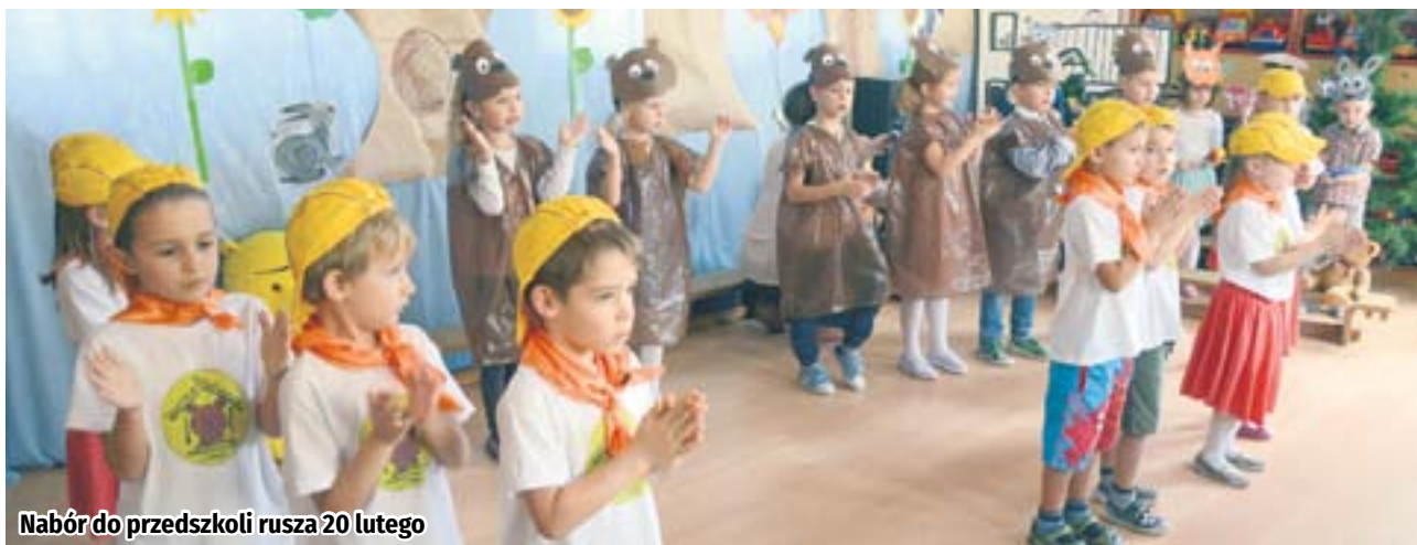
Nabór do przedszkoli rusza 20 lutego

Z wykorzystaniem systemu elektronicznego prowadzona będzie rekrutacja do zabrzańskich publicznych przedszkoli i oddziałów przedszkolnych zorganizowanych w publicznych szkołach podstawowych w roku szkolnym 2018/2019. Nabór rusza 20 lutego i potrwa do 5 marca.