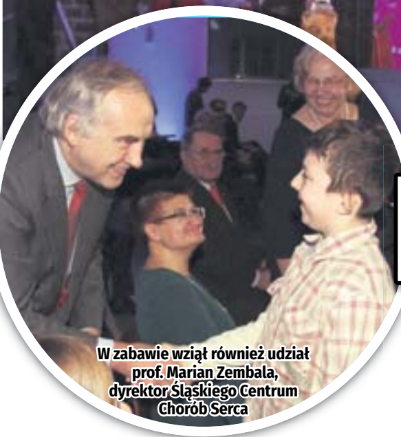
W zabawie wzięt również udział prof. Marian Zembala, dyrektor Śląskiego Centrum Chorób Serca

W zabrzańskiej Łaźni Łańcuszkowej odbył się w piątek finał 17. już edycji akcji Dziennika Zachodniego „Wybierz sobie Mikołaja”. Darczyńcami po raz kolejny zostały znane w regionie osobistości ze świata polityki, kultury, medycyny i biznesu.