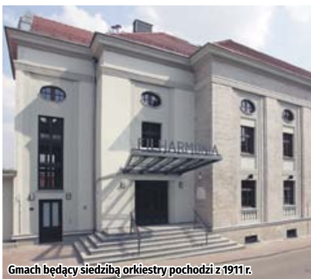
Gmach będący siedzibą orkiestry pochodzi z 1911 r.