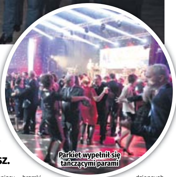
Parkiet wypełnił się tańczącymi parami