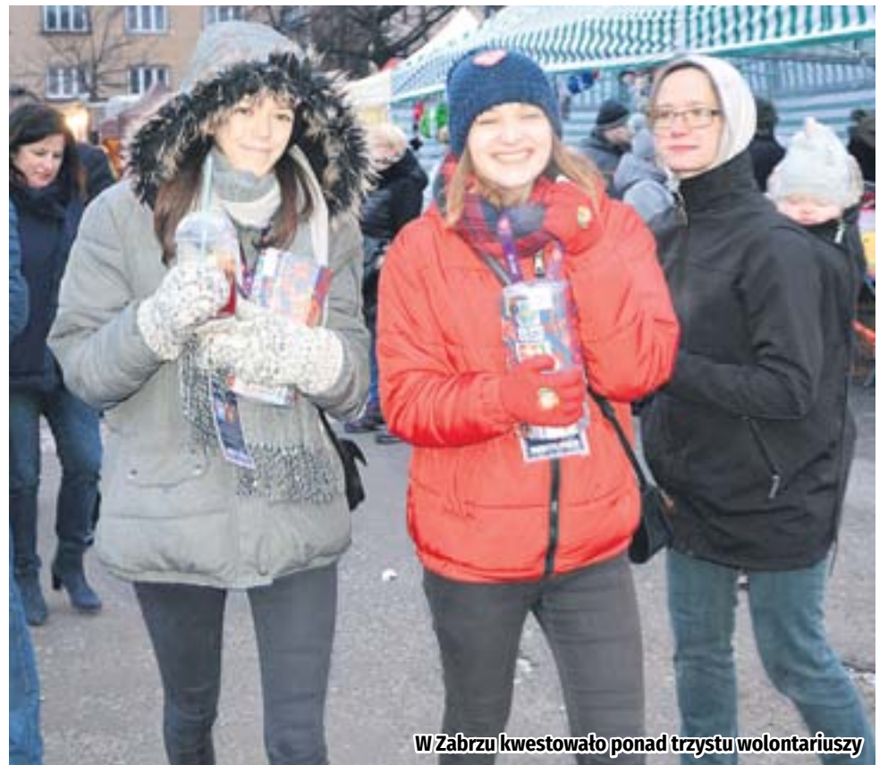
W Zabrzu kwestowało ponad trzystu wolontariuszy

Podsumowaniem Finału WOŚP było tradycyjne światelko do nieba w wykonaniu Teatru Ognia Nam-Tara oraz koncert duetu Bas Tajpan & Bob One. Neonatologia wcześniej była celem Finałów WOŚP już siedmiokrotnie. Dzięki Wielkiej Orkiestrze Świątecznej Pomocy na wszystkie oddziały noworodkowe w Polsce trafiły 3844 urządzenia medyczne za łączną kwotę prawie 122 mln zł. Rodzice najmniejszych pacjentów mogą dziś, w razie potrzeby, liczyć na gotowość do pracy 1160 inkubatorów, 367 stanowisk do resuscytacji noworodków czy 344 kardiomonitorów. (hm)