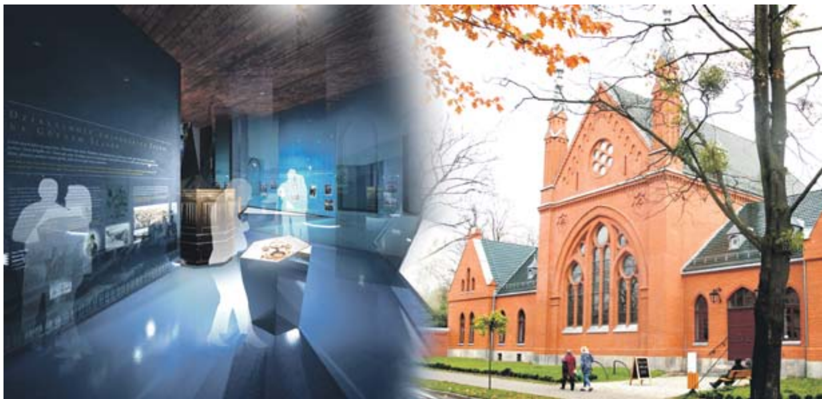
Wizualizacja: Sebastian Kucharuk, Natalia Romik, Piotr Jakowenko