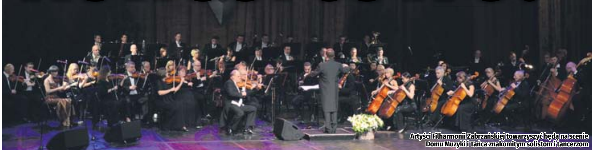
Artyści Filharmonii Zabrzeńskiej towarzyszyć będą na scenie Domu Muzyki i Tańca znakomitym solistom i tancerzom

Nie trzeba jechać do Wiednia, by nowy rok rozpocząć w równie efektowny sposób, jak nad Dunajem. Koncert Noworoczny w Domu Muzyki i Tańca na stałe wpisał się już w kalendarz wydarzeń kulturalnych w Zabrzu. Znakomitych solistów i towarzyszących im artystów Filharmonii Zabrzeńskiej będzie można podziwiać już 1 stycznia o godzinie 17.