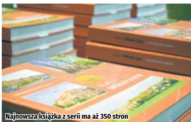
Najnowsza książka z serii ma aż 350 stron

Ponad 90 tekstów i około 640 zdjęć zgromadzonych na 350 stronach. Tak w największym skrócie można opisać najnowszy album z cyklu prezentującego dzielnicę Zabrze. W Młodzieżowym Domu Kultury nr 1 odbyła się w poniedziałek promocja wydawnictwa „Nasze Mikulczyce”.