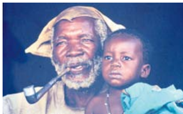
fol. Olivier Föllmi