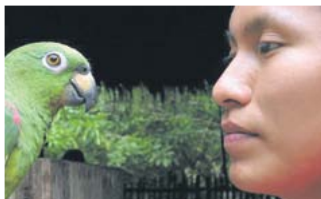
fol. Olivier Föllmi