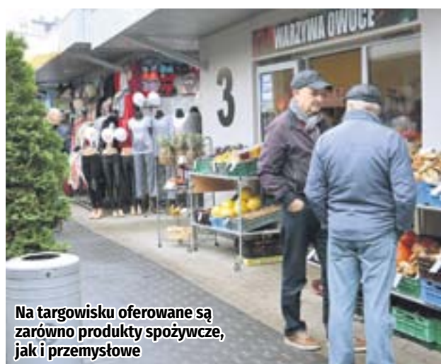
Na targowisku oferowane są zarówno produkty spożywcze, jak i przemysłowe