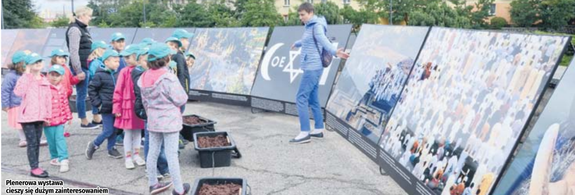
Plenerowa wystawa cieszy się dużym zainteresowaniem

Do 21 października można jeszcze składać prace w ramach konkursu towarzyszącego plenerowej wystawie fotograficznej „Ja i Ty – w poszukiwaniu nowej solidarności”, którą podziwiać można przed Domem Muzyki i Tańca w Zabrzu. Przyjmowane są zarówno prace literackie, jak i plastyczne.