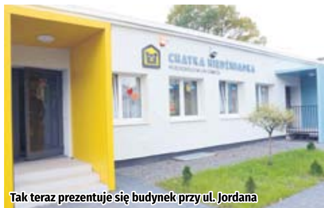
Tak teraz prezentuje się budynek przy ul. Jordana

Ponad setka maluchów, ich rodzice i opiekunowie z Przedszkola nr 6 w Zabrzu mają powody do zadowolenia. W popularnej „Chatce Niedźwiadka” zakończyła się właśnie gruntowna termomodernizacja.