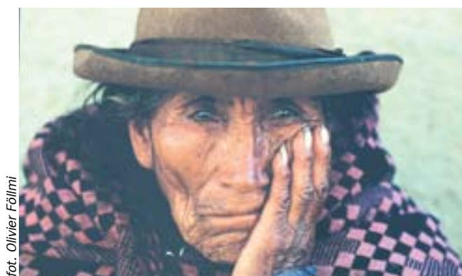
fol. Olivier Föllmi