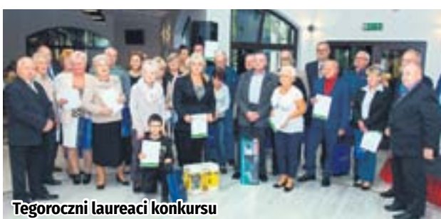
Tegoroczni laureaci konkursu

Rywalizacja na najładniej zaaranżowane balkony czy ogródki działkowe rozstrzygnięta. W ubiegłym tygodniu poznaliśmy laureatów tegorocznej edycji konkursu „Zielone Zabrze”. Nagrody zostały wręczone podczas spotkania w restauracji „Pod Kasztanami”.