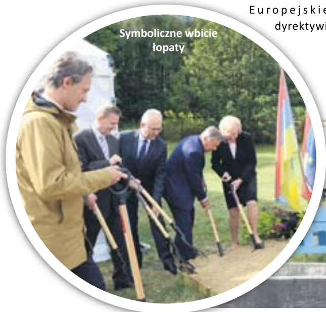
Symboliczne wbicie łopaty