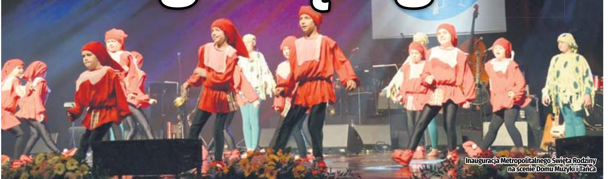
Inauguracja Metropolitalnego Święta Rodziny na scenie Domu Muzyki i Tańca