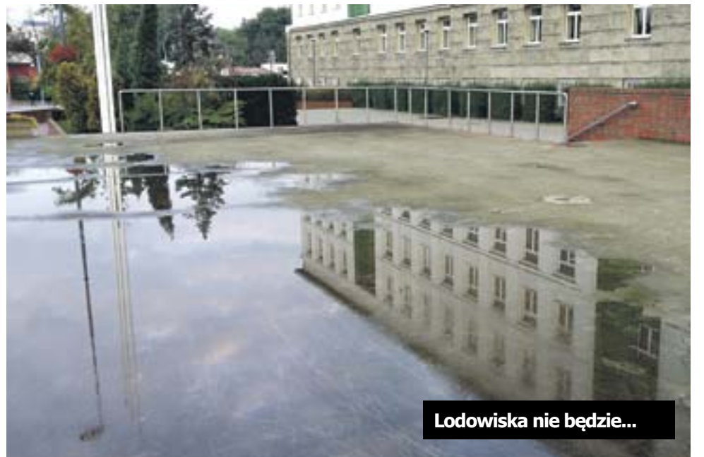
Lodowiska nie będzie...