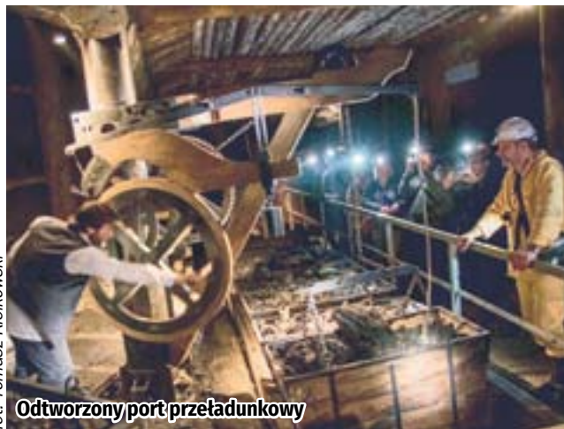
Odtworzony port przeładunkowy

To będzie kluczowy moment trwającego w Zabrzu V Międzynarodowego Festiwalu im. Krzysztofa Pendereckiego. W piątek 29 września w naziemnej części kompleksu Sztolnia Królowa Luiza zabrzmie dzieło „Siedem bram Jerozolimy”. Tego samego dnia oficjalnie otwarta zostanie przygotowana w podziemnych wyrobiskach trasa turystyczna. Dla osób odwiedzających ją w najbliższy weekend przygotowano szereg atrakcji.