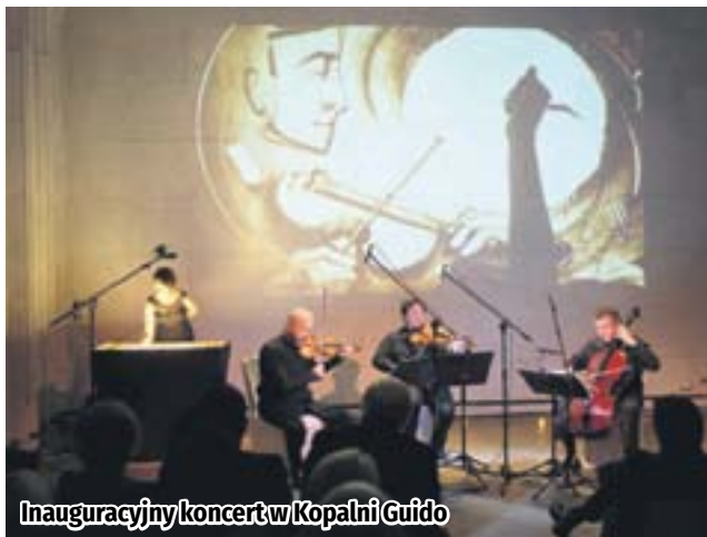
Inauguracyjny koncert w Kopalni Guido

Na sobotę zaplanowano również wiele wydarzeń towarzyszących w kompleksie Sztolnia Królowa Luiza przy ul. Wolności 410. W programie m.in. darmowe zwiedzenie naziemnej części Sztolni, wejście na wieżę szybu „Carnall”, warsztaty gotowania po śląsku oraz zabawy dla dzieci. O godzinie 18 koncert Górnośląskie Axis Mundi – Opowieści stąd. Natomiast o godzinie 20 w budynku Łaźni Łańcuszkowej odbędzie się koncert ERITH. Znakiem rozpoznawczym 22-letniej wokalistki jest charakterystyczny taniec i towarzysząca jej koncertom gra świateł.