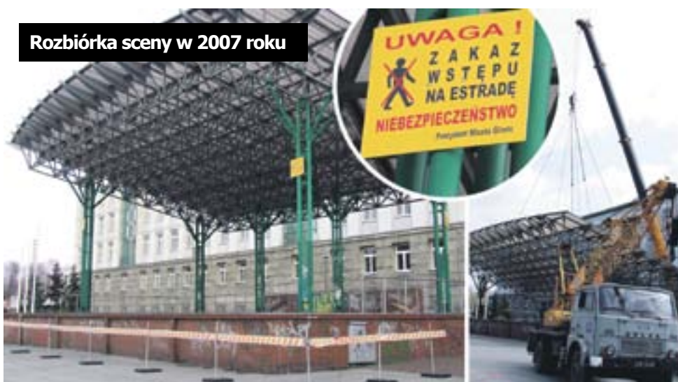
Rozbiórka sceny w 2007 roku