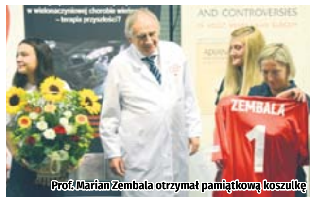
Prof. Marian Zembala otrzymał pamiątkową koszulkę