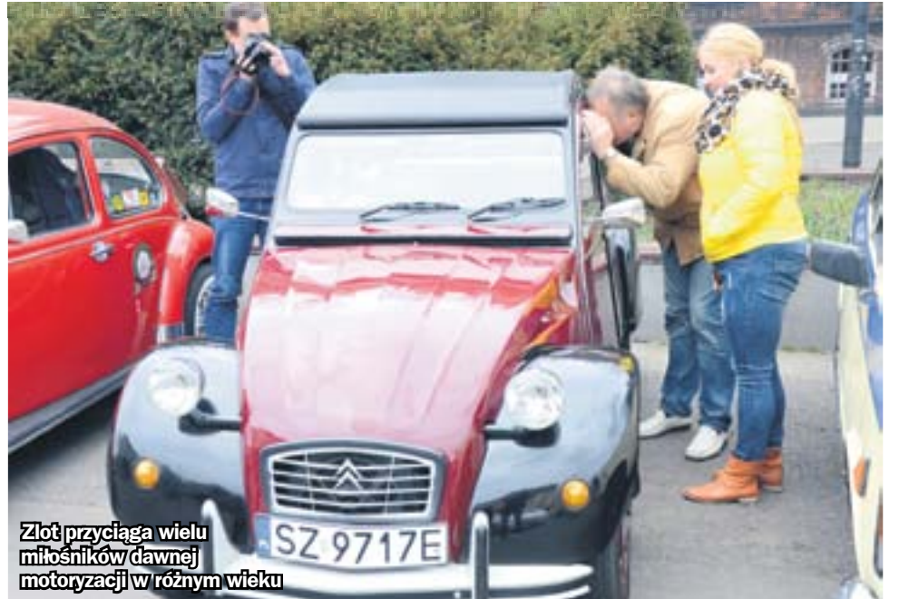
Złot przyciąga wielu miłośników dawnej motoryzacji w różnym wieku

Fiaty 125p i 126p, trabanty, zastawy, polonezy, wartburgi, datsuny i zabytkowe toyoty to niektóre z samochodów, jakie będzie można podziwiać podczas kolejnej odsłony akcji Zabrzeńskie Klasyki Nocą. Motoryzacyjne perełki wyjadą na ulice 26 sierpnia.