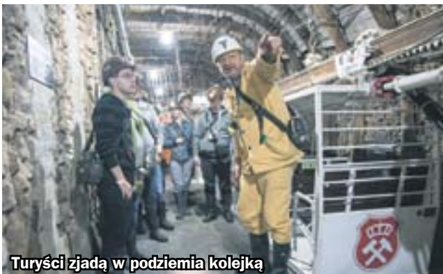
Turyści zjadają w podziemia kolejką

Ma około 1,5 kilometra długości i prezentuje rozwój górnictwa na przestrzeni ostatnich dwustu lat. Już wkrótce dla turystów otwarta zostanie pierwsza część podziemnej trasy w kompleksie Sztolnia Królowa Luiza.