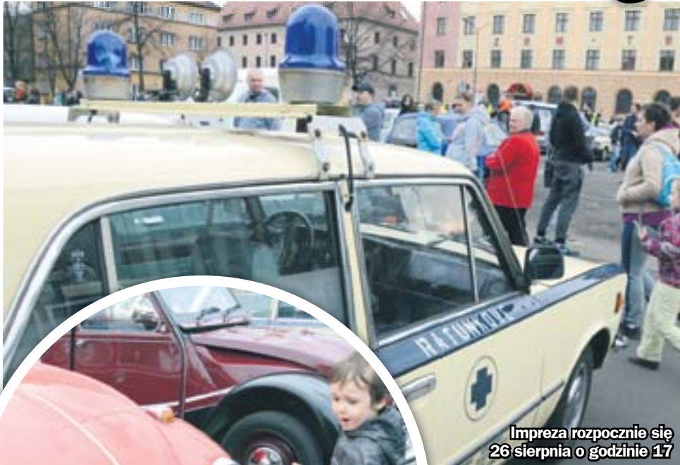
Impreza rozpocznie się 26 sierpnia o godzinie 17