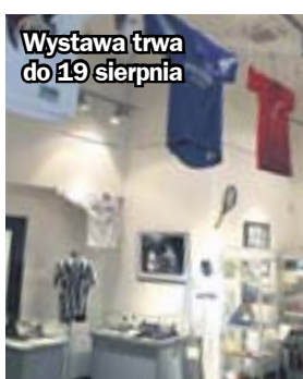
Wystawa trwa do 19 sierpnia

watnych archiwów – to część zbiorów, które muzeum chce pokazać zwiedzającym. Kolekcję uzupełniają bilety, plakaty i programy meczowe. Najstarsze pamiątki pamiętają czasy przedwojenne i okres rodzenia się sportu w Zabrzu po II wojnie światowej. Prezentowane są też ekspozyty z ostatnich lat, świadczące o tym, że zabrzeński sport to nie tylko historia. (hm)