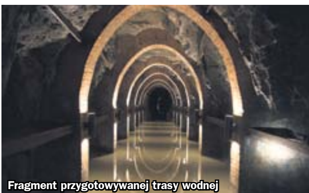
Fragment przygotowywanej trasy wodnej