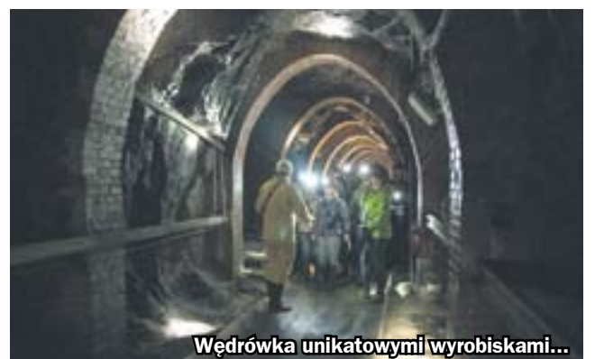
Wędrowka unikatowymi wyrobiskami...