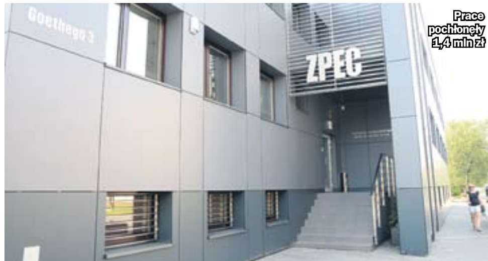
Prace pochłonęły 1,4 mln zł