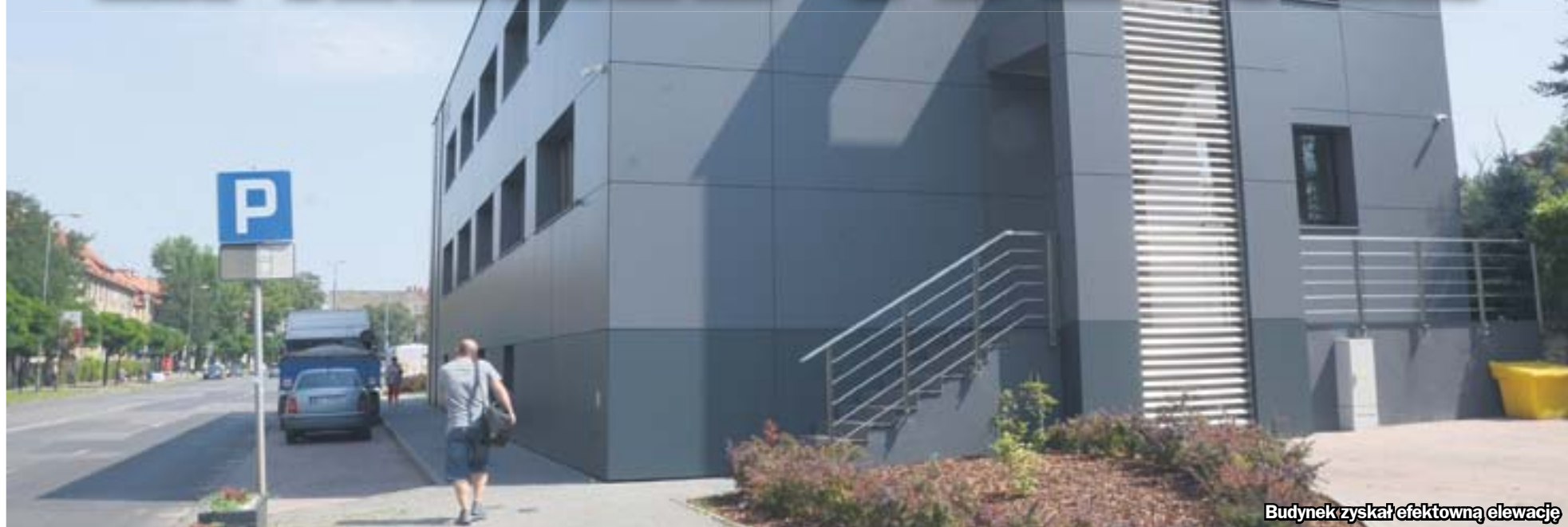
Budynek zyskał efektowną elewację

Całkowicie zmieniła swe oblicze siedziba Zabrzeńskiego Przedsiębiorstwa Energetyki Ciepłej. Budynek przeszedł gruntowną termomodernizację.