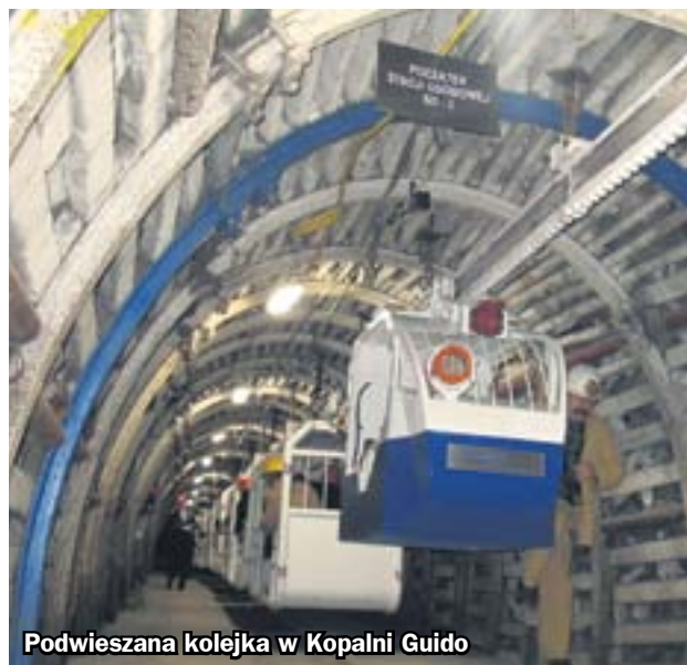
Podwieszana kolejka w Kopalni Guido

O tytuł jednego z siedmiu nowych cudów Polski ubiega się zabrzeńska Kopalnia Guido. O wynikach tegorocznej edycji plebiscytu magazynu National Geographic zdecydują czytelnicy oraz internauci.