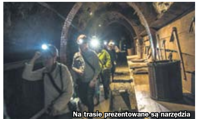
Na trasie prezentowane są narzędzia