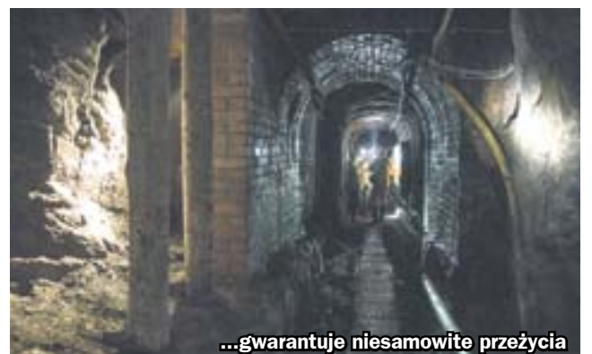
...gwarantuje niesamowite przeżycia