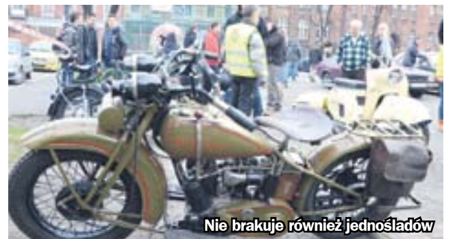
Nie brakuje również jednośladów

burgi czy datsuny i zabytkowe toyoty – dodaje. Podczas imprezy prowadzona będzie zbiórka na rzecz podopiecznych Schroniska dla Bezdomnych Zwierząt „Psitulmnie”. Zwierzakom można przekazać karmę w puszkach, makaron, ryż, środki czystości, koce, ręczniki, a także koldry i poduszki (ale nie z pierzem). Potrzebne są również obroże, szelki i smycze. (hm)