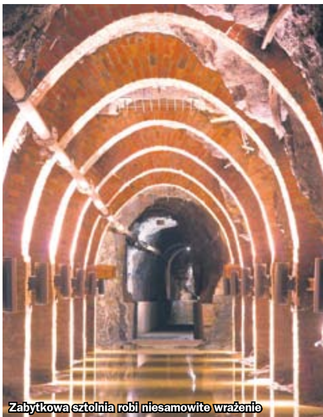
Zabytkowa sztolnia robi niesamowite wrażenie