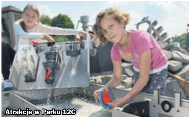
Atrakcje w Parku 12C

Na ten moment z niecierpliwością czekali miłośnicy turystyki przemysłowej! Podczas zaplanowanej na 10 czerwca kolejnej edycji Industriady na przedpremierowe zwiedzanie zaprosi Sztolnia Królowa Luiza w Zabrzu. Obejmie ono przejście przez fragment niedostępnej do tej pory Głównej Kluczowej Sztolni Dziedzicznej.