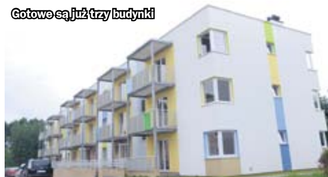
Gotowe są już trzy budynki

Aby zamieszkać w wybranym lokalu, wystarczy partycypacja w kosztach jego budowy oraz wpłata kaucji w wysokości 12-krotnego czynszu. Szczegółowe informacje na temat oferty można uzyskać w siedzibie MTBS przy ul. Towarowej 1 w Tarnowskich Górach i pod numerem telefonu 32 380 90 06 lub 285 28 97. (hm)