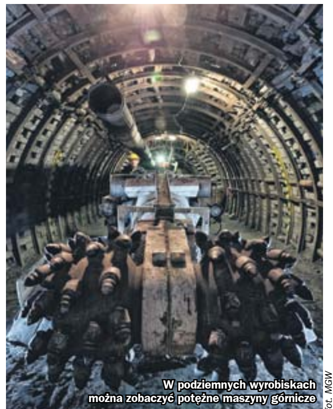
W podziemnych wyrobiskach można zobaczyć potężne maszyny górnictwa