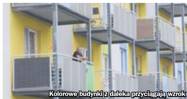
Kolorowe budynki z daleka przyciągają wzrok