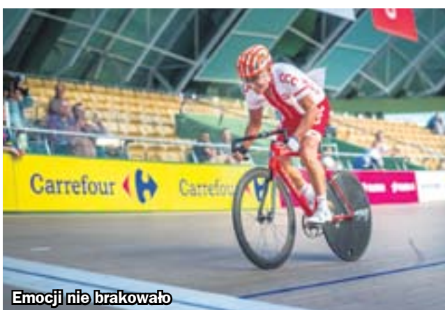
Emocji nie brakowało