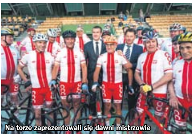
Na torze zaprezentowali się dawni mistrzowie

wszechniać w skali regionu i kraju atrakcyjne tereny inwestycyjne strefy ekonomicznej oraz obiekty warte odwiedzenia, jak Kopalnia Guido czy kompleks Sztolnia Królowa Luiza – dodaje. (hm)