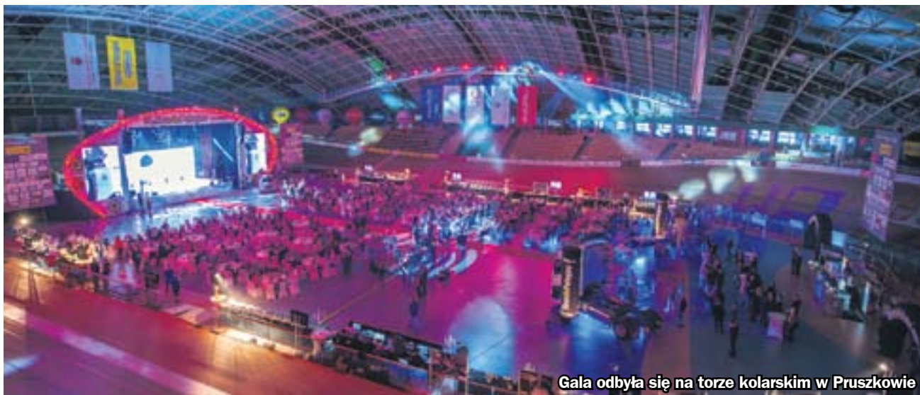
Gala odbyła się na torze kolarskim w Pruszkowie