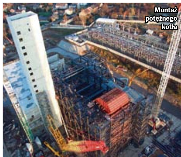
Montaż potężnego kotła

NA BUDOWIE NOWEJ ELEKTROCIĘPŁOWNI FORTUM ROZPOCZĄŁ SIĘ KOLEJNY ETAP PRAC