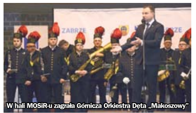
W hali MOSIR-u zagrała Gómicza Orkiestra Dęta „Makoszowy”