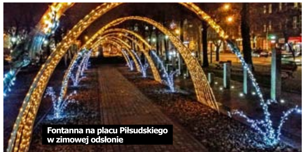
Fontanna na placu Piłsudskiego w zimowej odsłonie

W Gliwicach stanie też nowa, dziesięciometrowa choinka. Drzewko ustawione zostanie przed Urzędem