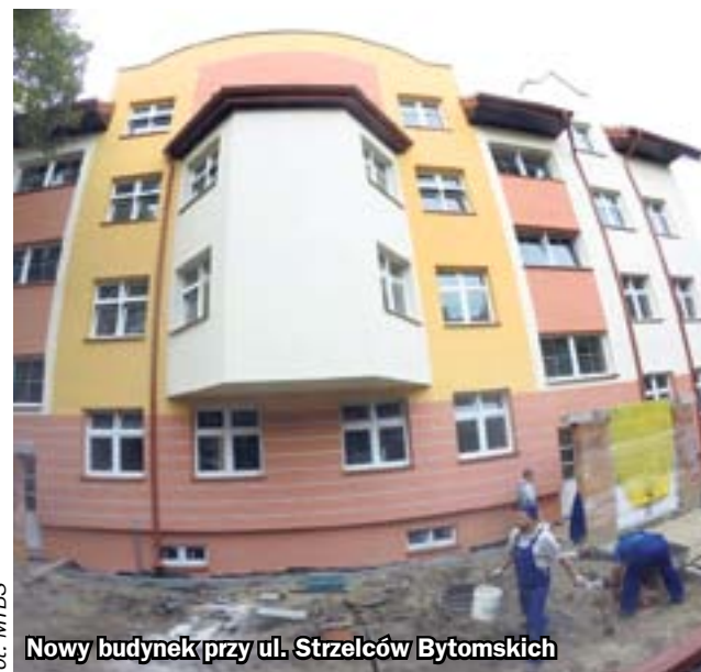
Nowy budynek przy ul. Strzelców Bytomskich