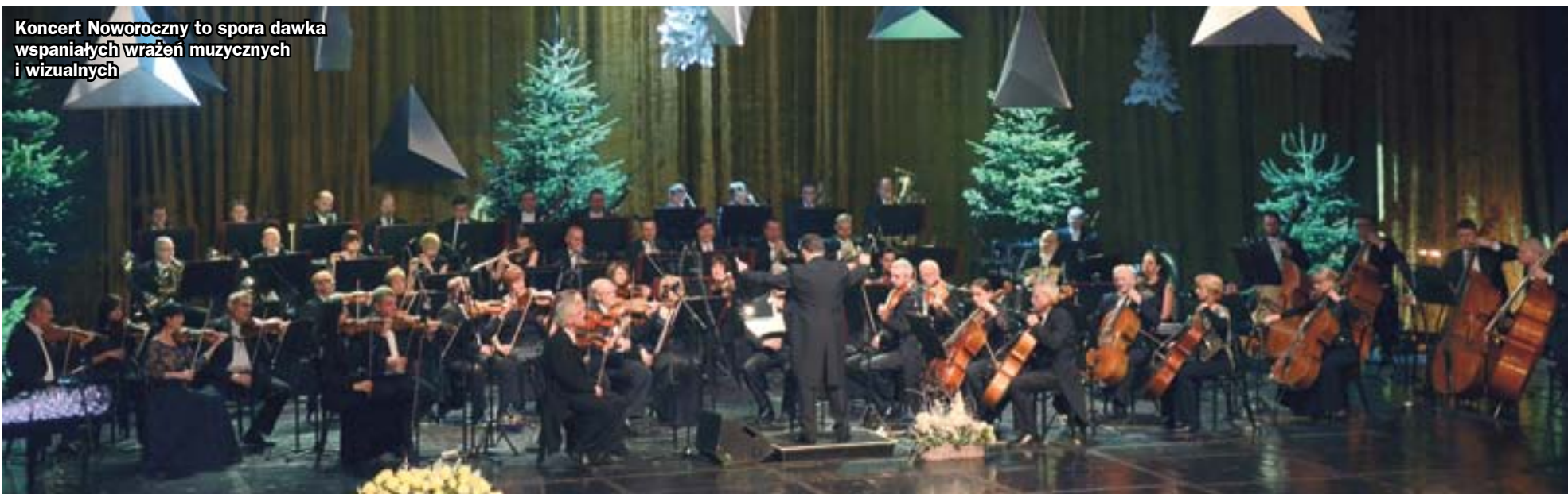
Koncert Noworoczny to spora dawka wspaniałych wrażeń muzycznych i wizualnych