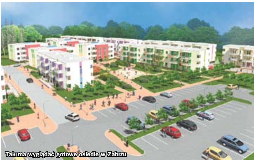
Tak ma wyglądać gotowe osiedle w Zabrzu

W przypadku obu lokalizacji przyjmowane są jeszcze wnioski na wolne mieszkania. Ich formularze wraz z załącznikami dostępne są na stronie www.mtbstg.pl . (rj)