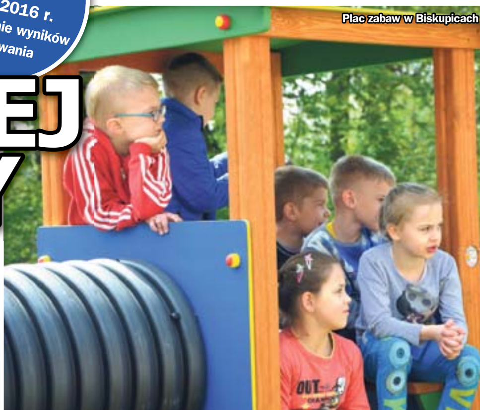
Plac zabaw w Biskupicach