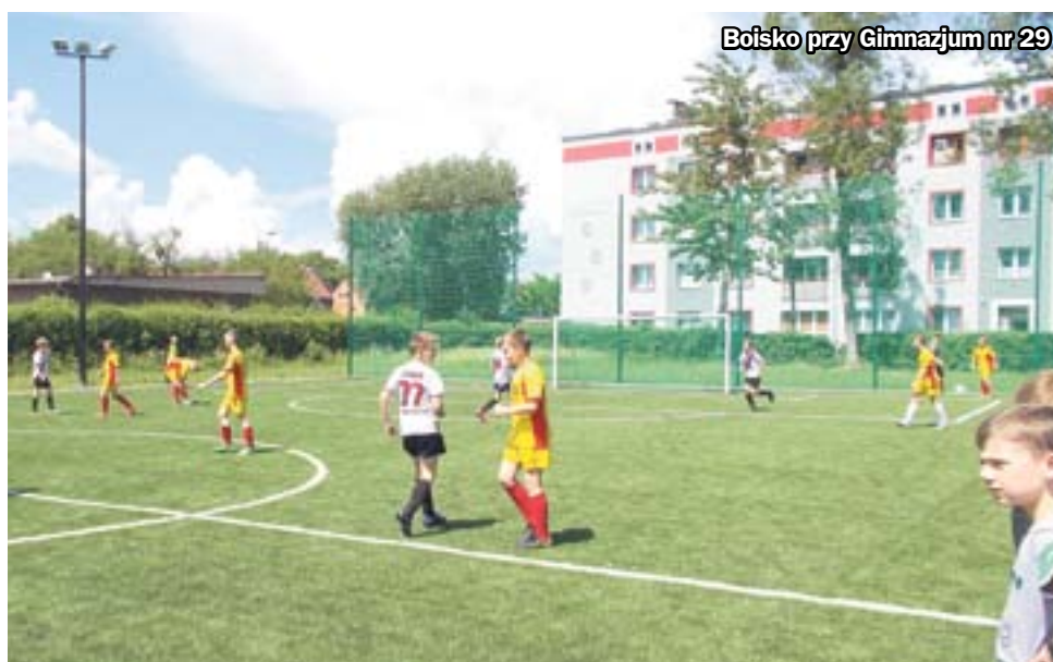
Boisko przy Gimnazjum nr 29