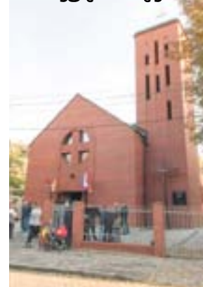
Tak wygląda świątynia