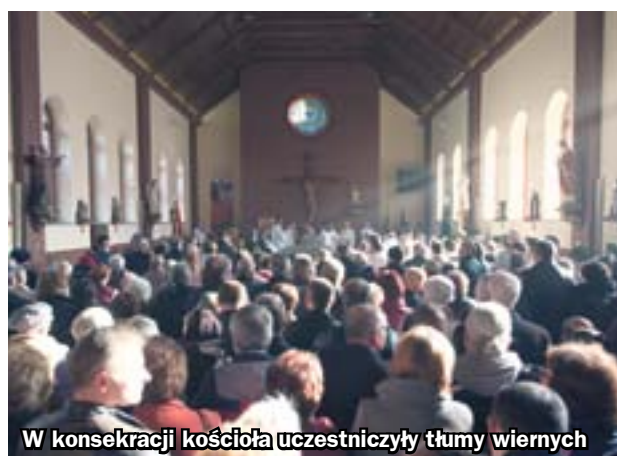
W konsekracji kościoła uczestniczyły tłumy wiernych