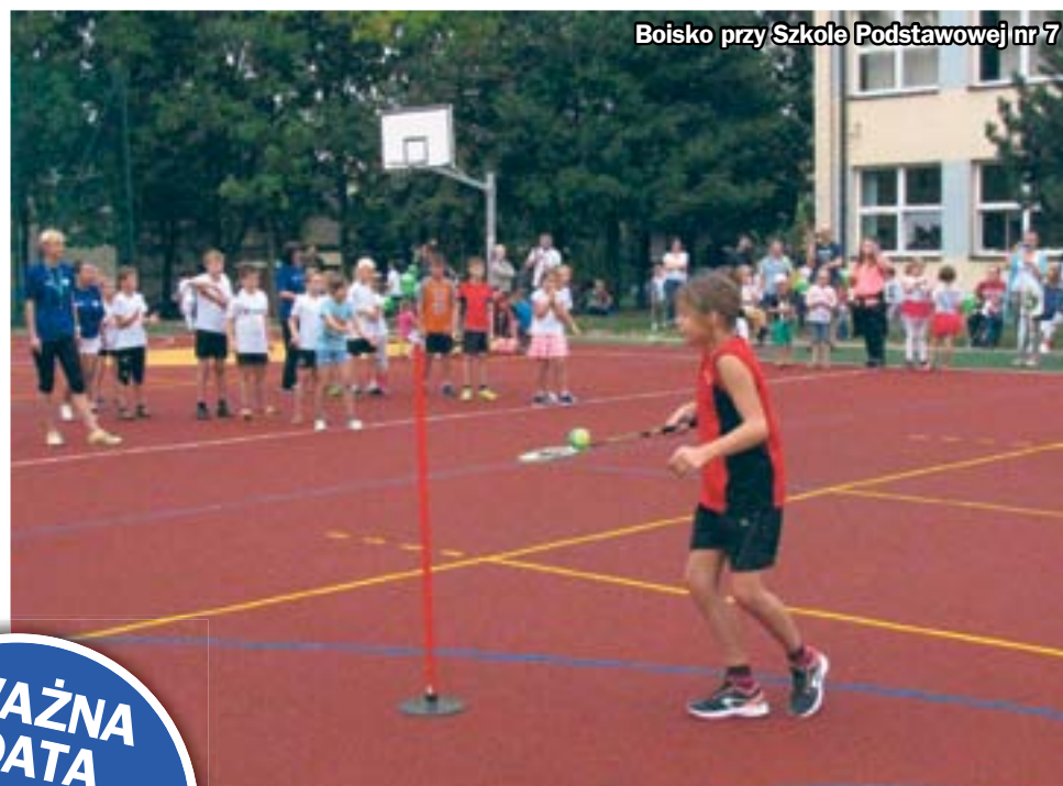
Boisko przy Szkole Podstawowej nr 7

Przypomnijmy, że do tej pory dzięki środkom w ramach budżetu partycypacyjnego powstały m.in. miejsca do rekreacji w Biskupicach, boiska przy Szkole Podstawowej nr 7 oraz Gimnazjum nr 29, Centrum Integracji Osiedla Kotarbińskiego czy solarne oświetlenie chodnika w sąsiedztwie Przedszkola nr 36 na osiedlu Kopernika. (hm)