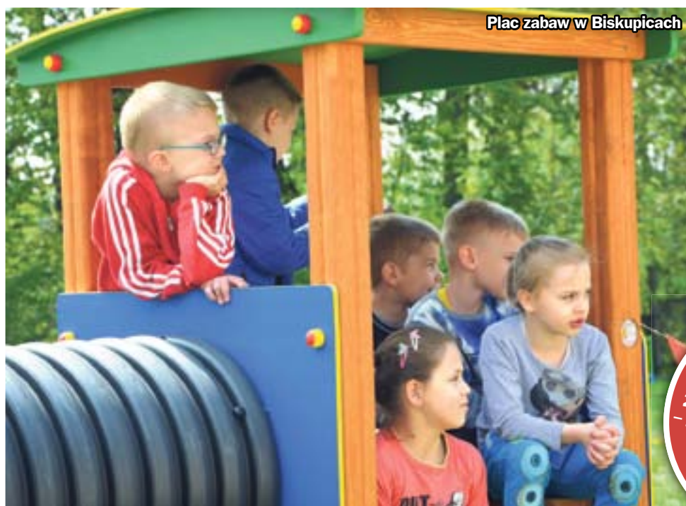
Plac zabaw w Biskupicach