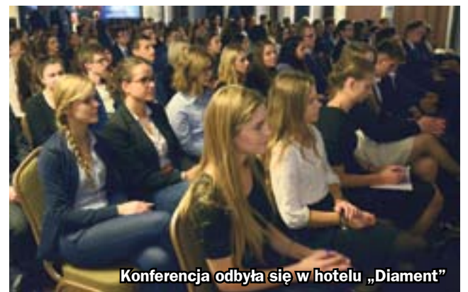
Konferencja odbyła się w hotelu „Diamant”

Trzydniowa konferencja trwała od czwartku do soboty. W jej programie znalazło się spotkanie dzieciaków wydziałów realizujących w kraju proces kształcenia na kierunku inżynieria biomedyczna. Jego tematem było wypracowanie propozycji zmian legislacyjnych umożliwiających w sposób skuteczny zatrudnianie absolwentów tego kierunku w jednostkach służby zdrowia. (hm)