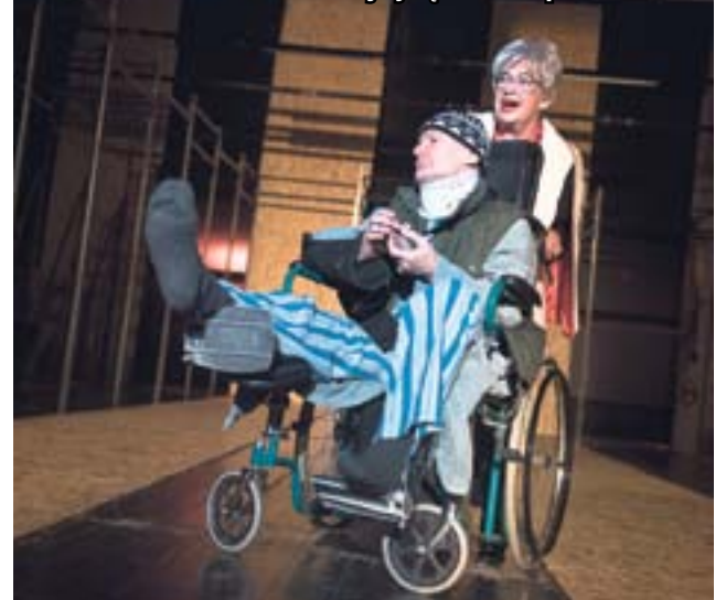
Publiczność obejrzy łącznie 15 przedstawień

Festiwalowi tradycyjnie towarzyszy szereg innych imprez. Zaplanowano m.in. warsztaty teatralne oraz czytanie dramatu. Po każdym spektaklu konkursowym odbywają się także spotkania i dyskusje z twórcami. Szczegóły na stronie www.teatrzabrze.pl . (hm)