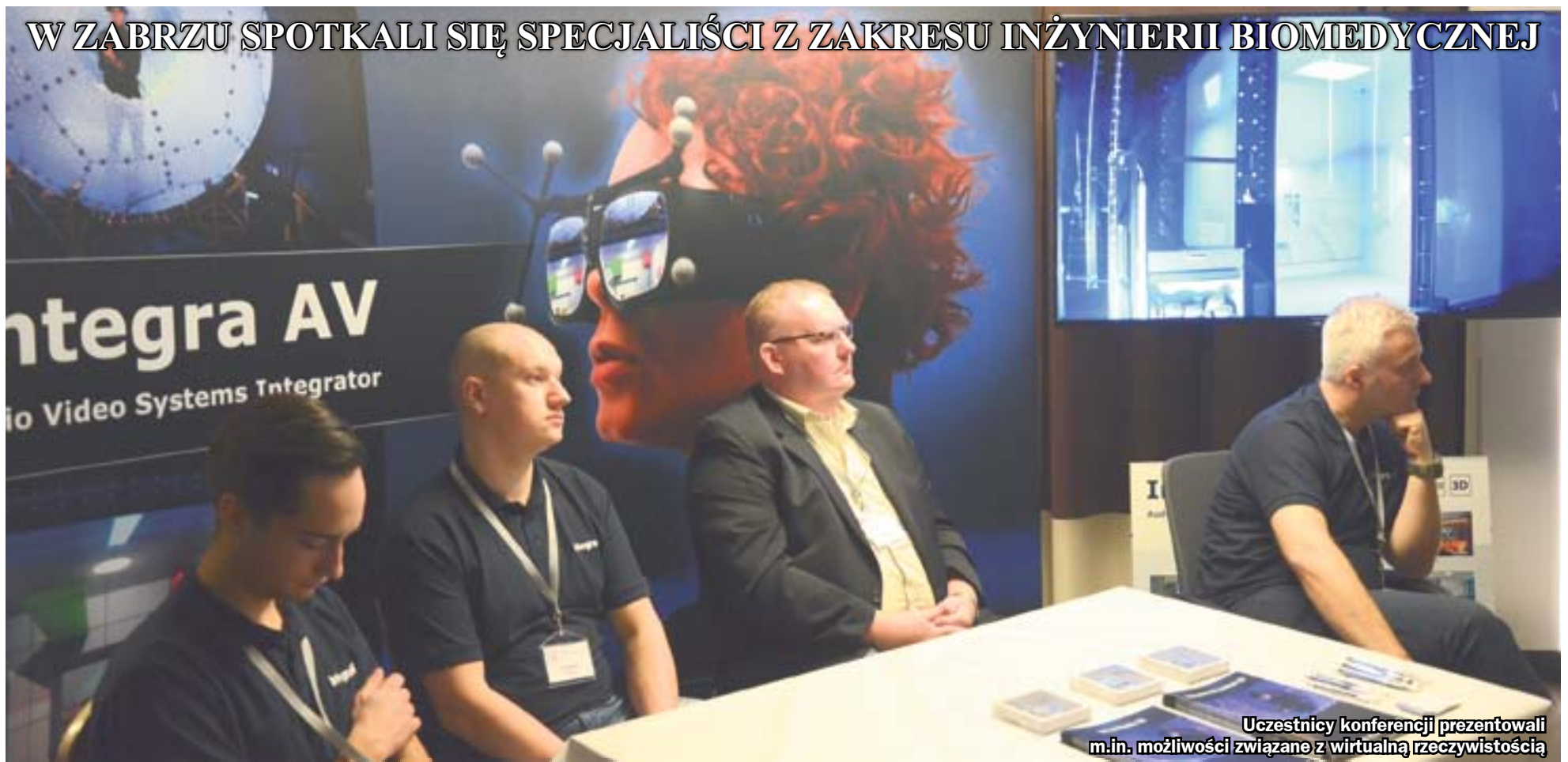
Uczestnicy konferencji prezentowali m.in. możliwości związane z wirtualną rzeczywistością