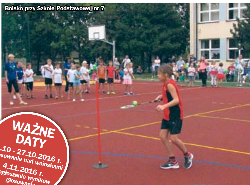
Boisko przy Szkole Podstawowej nr 7

WAŻNE DATY 21.10 - 27.10.2016 r. - głosowanie nad wnioskami 4.11.2016 r. - ogłoszenie wyników głosowania