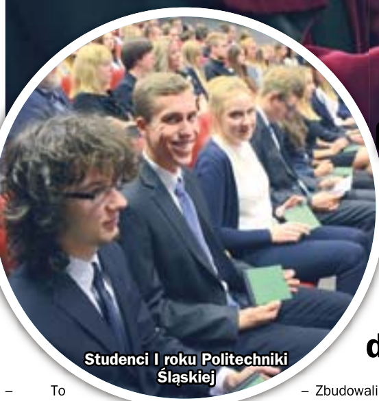
Studenci I roku Politechniki Śląskiej

Na zabrzańskich wydziałach Politechniki Śląskiej oficjalnie zainaugurowano w ubiegłym tygodniu nowy rok akademicki. W mury swych uczelni wrócili studenci inżynierii biomedycznej oraz organizacji i zarządzania. Do starszych kolegów i koleżanek dołączyli także ci, którzy po indeks sięgnęli po raz pierwszy.