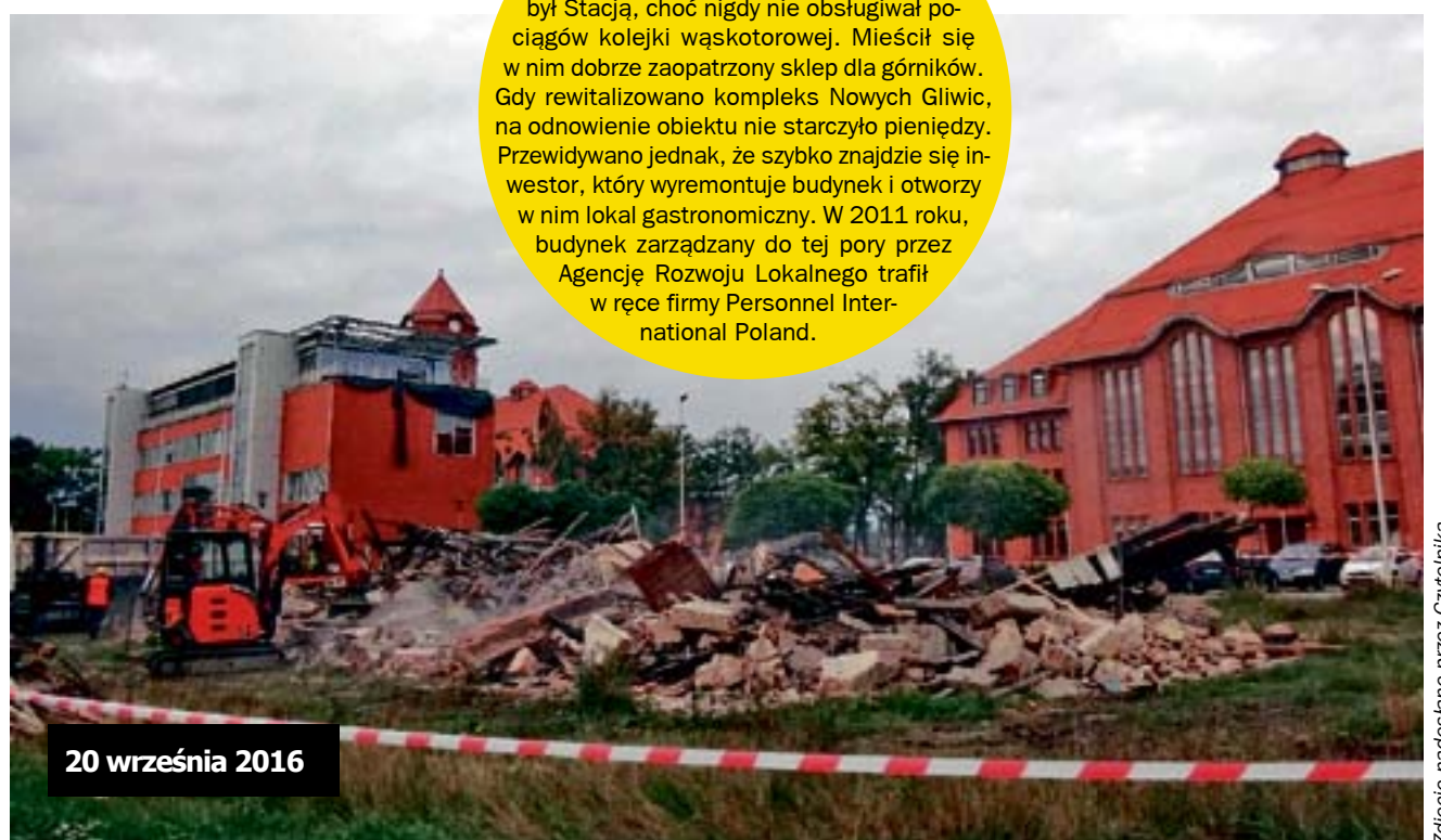
20 września 2016

W okresie funkcjonowania Kopalni Gliwice, obiekt wchodził w jej skład i pełnił funkcje usługowe. Nazywany był Stacją, choć nigdy nie obsługiwał pociągów kolejki wąskotorowej. Mieścił się w nim dobrze zaopatrzone sklepy dla górników. Gdy rewikalizowano kompleks Nowych Gliwic, na odnowienie obiektu nie starczyło pieniędzy. Przewidywano jednak, że szybko znajdzie się inwestor, który wyremontuje budynek i otworzy w nim lokal gastronomiczny. W 2011 roku, budynek zarządzany do tej pory przez Agencję Rozwoju Lokalnego trafił w ręce firmy Personnel International Poland.