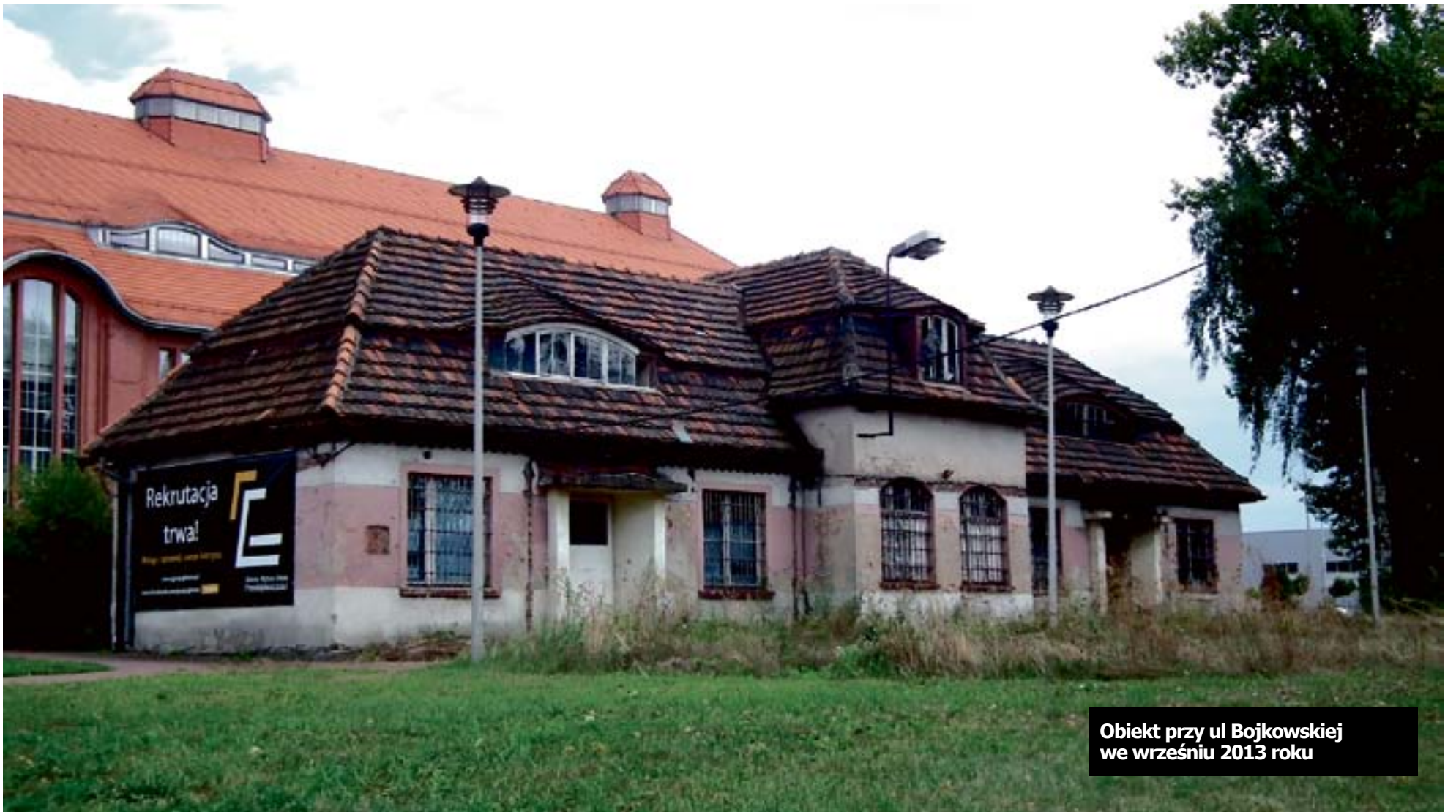
Obiekt przy ul Bojkowskiej we wrześniu 2013 roku