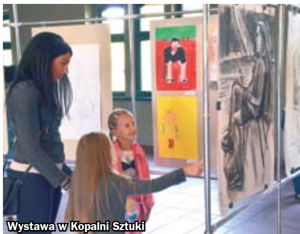
Wystawa w Kopalni Sztuki

Prace laureatów 19. Międzynarodowego Festiwalu Rysowania oglądać można w Kopalni Sztuki przy ul. Hagera 41 w Zabrzu. Uroczysty wernisaż wystawy, połączony z wręczeniem nagród, odbył się w miniony piątek.