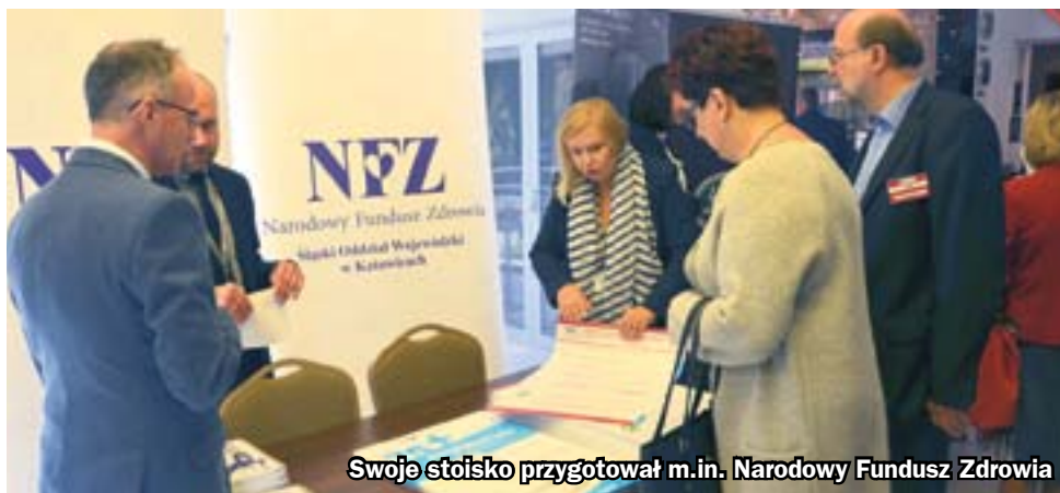
Swoje stoisko przygotował m.in. Narodowy Fundusz Zdrowia

W Zabrzu spotkali się przedstawiciele wszystkich najważniejszych organizacji pracodawców w ochronie zdrowia. To okazja do rozmowy na temat zmian w systemie ochrony zdrowia, w przededniu tych zmian. Chcemy dyskutować o tym w szczególnym miejscu, bo przecież w Zabrzu z jednej strony doskonale funkcjonują prywatne praktyki lekarzy rodzinnych, z drugiej mamy nasz Szpital Miejski, znakomity ośrodek transplantologii, jakim jest Śląskie Centrum Chorób Serca czy też ośrodki działające w obszarze nowoczesnych technologii medycznych. Rozmawiamy o tym, co przed nami i jak w tej rzeczywistości mamy funkcjonować.