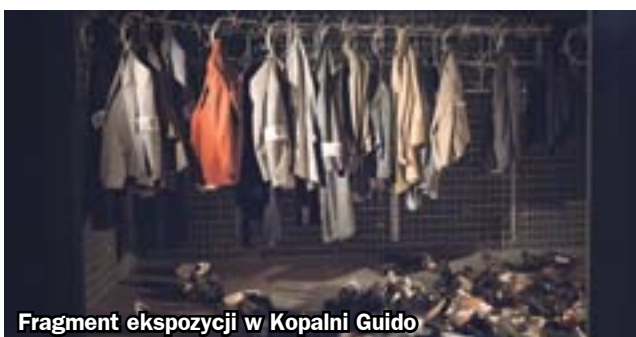
Fragment ekspozycji w Kopalni Guido