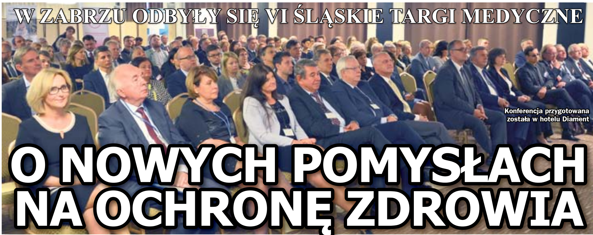
Konferencja przygotowana została w hotelu Diament