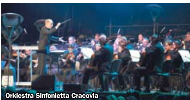
Orkiestra Sinfonietta Cracovia

Swoją polską premierę miała w Kopalni Guido opera „Dziennik Anne Frank”. Niezwykłych doznań dostarczył artystyczny projekt „Penderecki w ciemnościach”. Setki osób przyciągnął do naziemnej części Sztolni Królowa Luiza koncert „Beethoven industrialnie”. Czwarta edycja Międzynarodowego Festiwalu im. Krzysztofa Pendereckiego upłynęła pod znakiem wielkich wydarzeń.