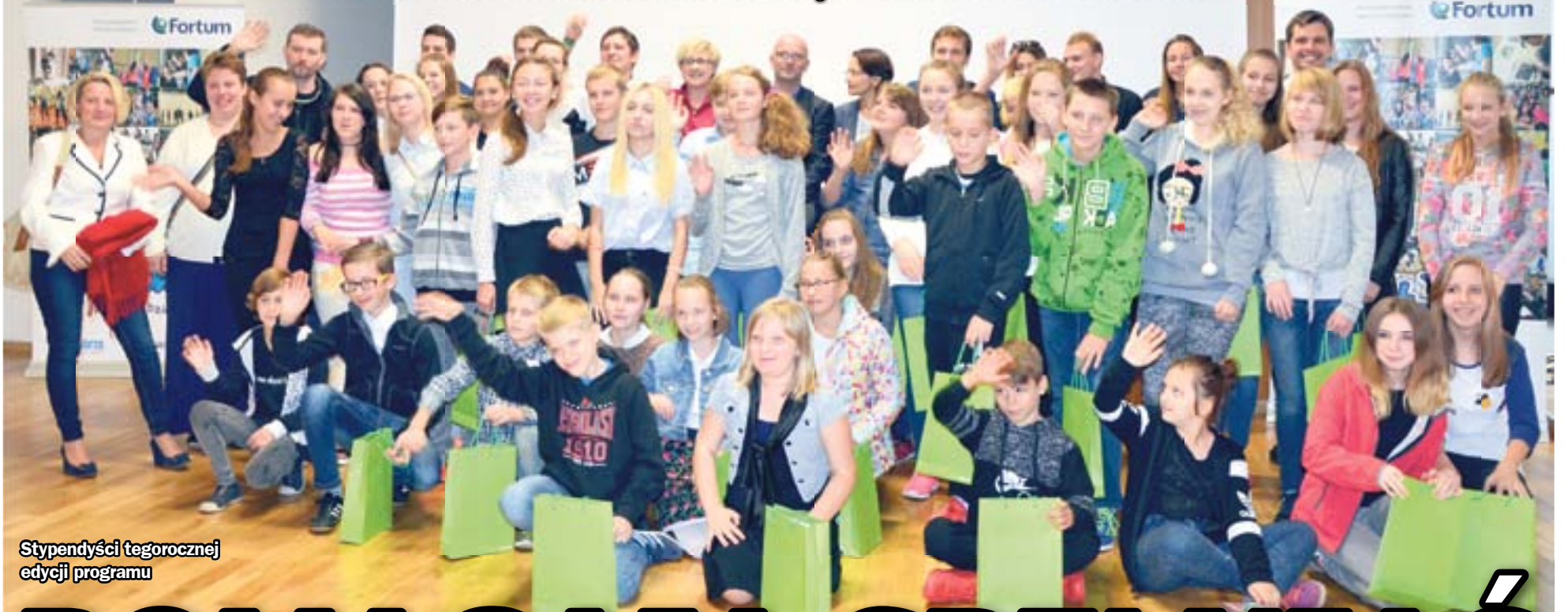
Stypendyści tegorocznej edycji programu