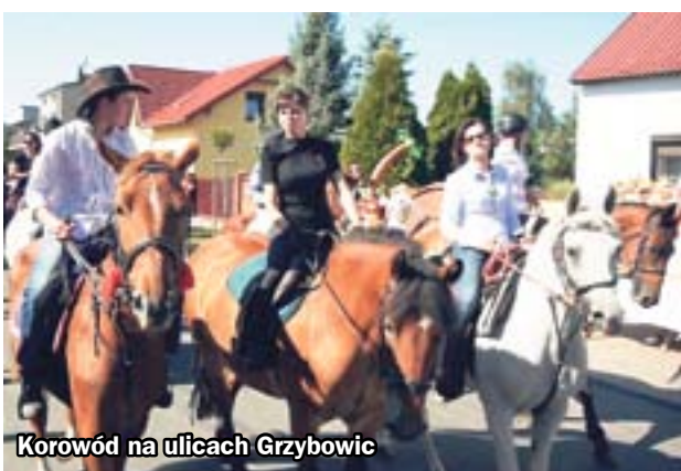
Korowód na ulicach Grzybowic

Na sobotę 3 września zaplanowano Zabrzeńskie Dożynki Miejskie, które tradycyjnie odbędą się w Grzybowicach. W programie z pewnością nie zabraknie atrakcji.