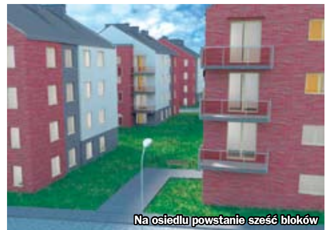
Na osiedlu powstanie sześć bloków

Przedstawiciele spółki podkreślają, że mieszkania na wynajem na Osiedlu Trocera są idealnym rozwiązaniem dla wszystkich, którzy chcą mieszkać nowoczesnie i wygodnie w centrum miasta, nie angażując ogromnych środków finansowych. (bt)