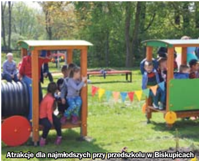
Atrakcje dla najmłodszych przy przedszkolu w Biskupicach