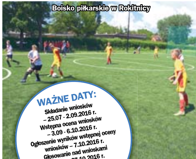
Boisko piłkarskie w Rokitnicy

WAŻNE DATY: Składanie wniosków - 25.07 - 2.09.2016 r. Wstępna ocena wniosków - 3.09 - 6.10.2016 r. Ogłoszenie wyników wstępnej oceny wniosków - 7.10.2016 r. Głosowanie nad wnioskami - 21.10 - 27.10.2016 r. Ogłoszenie wyników głosowania - 4.11.2016 r.