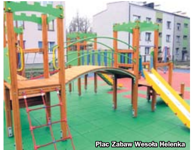
Plac Zabaw Wesoła Helenka

WAŻNE DATY: Składanie wniosków - 25.07 - 2.09.2016 r. Wstępna ocena wniosków - 3.09 - 6.10.2016 r. Ogłoszenie wyników wstępnej oceny wniosków - 7.10.2016 r. Głosowanie nad wnioskami - 21.10 - 27.10.2016 r. Ogłoszenie wyników głosowania - 4.11.2016 r.