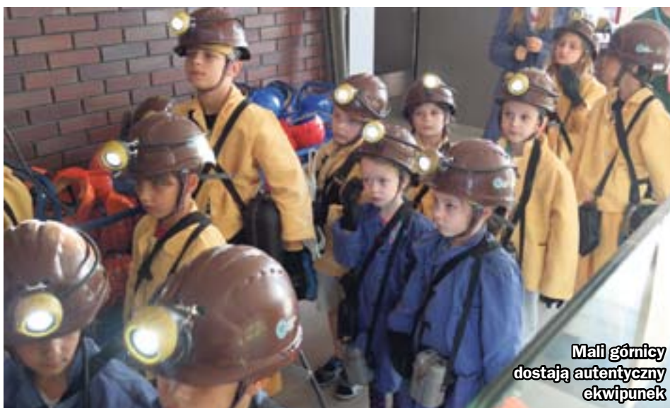
Mali górnicy dostają autentyczny ekwipunek