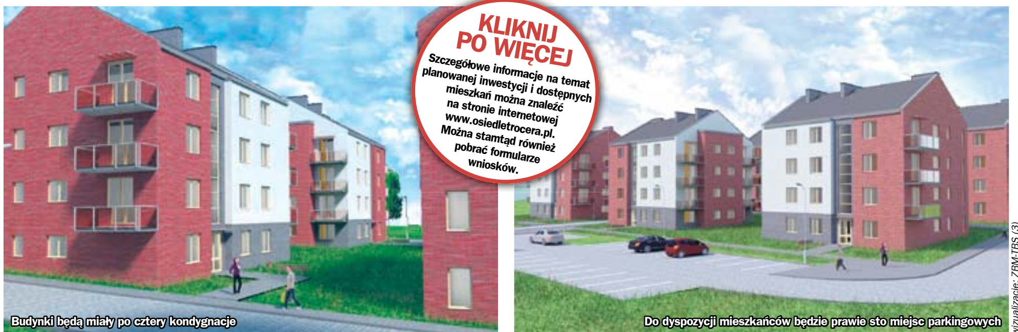
Budynki będą miały po cztery kondygnacje