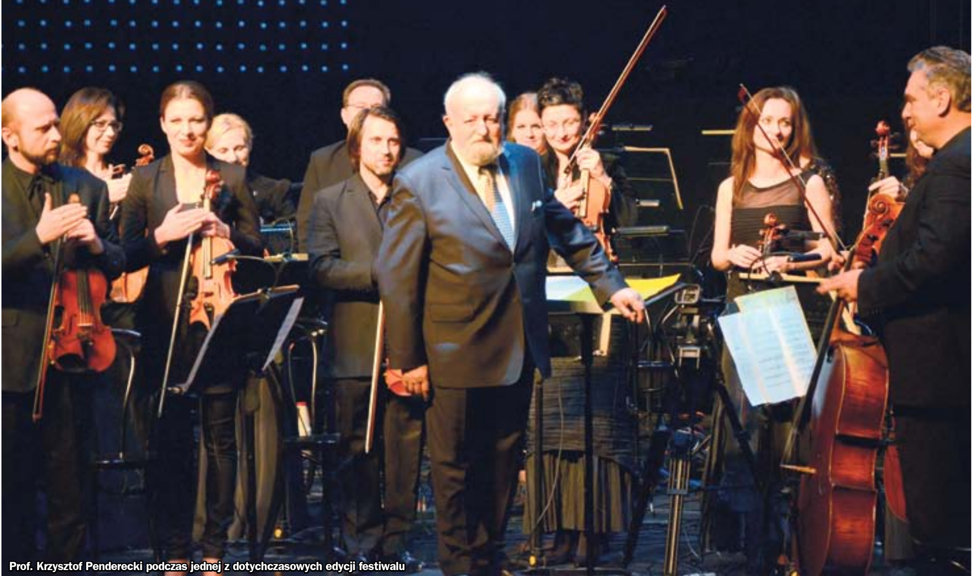
Prof. Krzysztof Penderecki podczas jednej z dotychczasowych edycji festiwalu