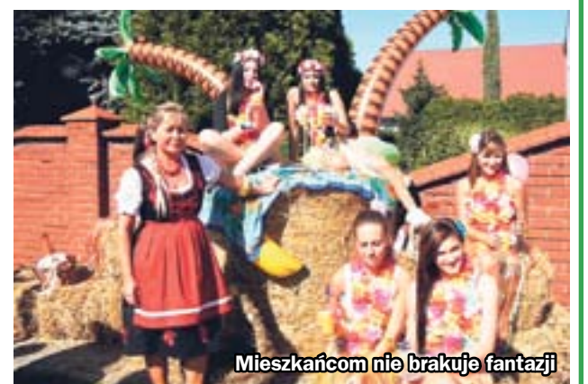
Mieszkańcom nie brakuje fantazji