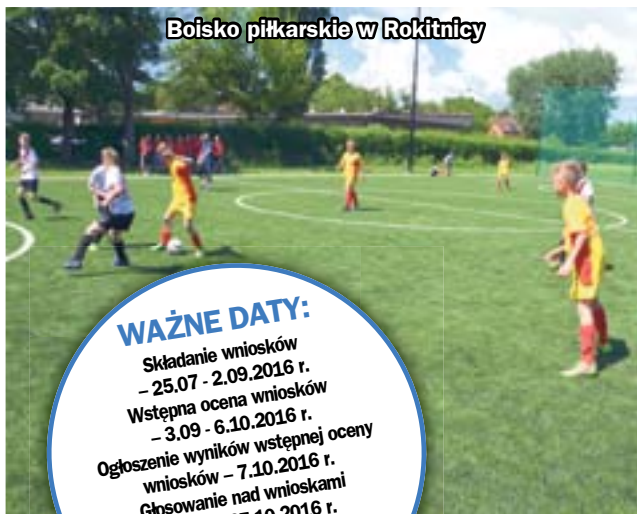
Boisko piłkarskie w Rokityńcu