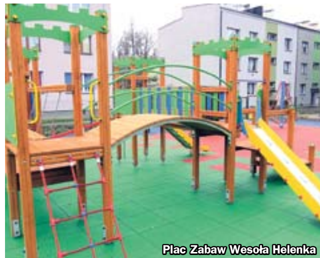
Plac Zabaw Wesoła Helenka