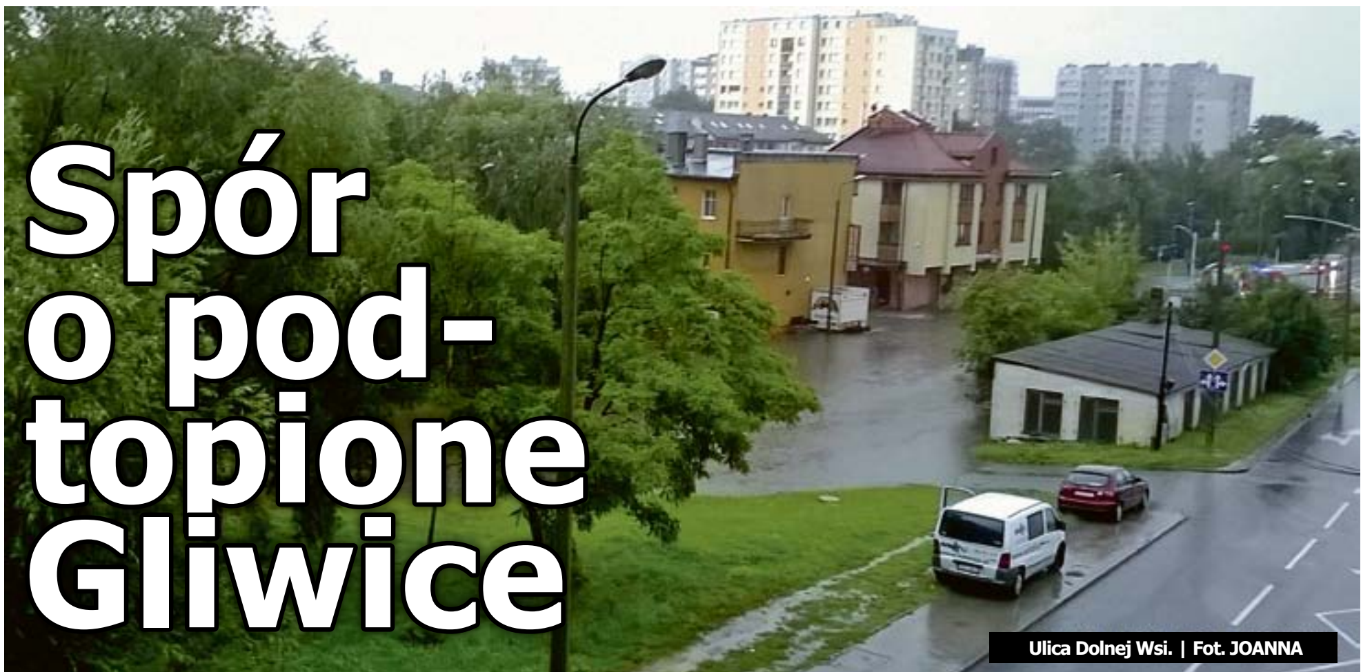
Ulica Dolnej Wsi.

W tle liczenia strat po niedawnym zalaniu Gliwic, toczy się dyskusja, jak uchronić miasto przed kolejnymi podtopieniami. Główna linia frontu przebiega w newralgicznym rejonie ul. Zygmunta Starego. O konsensusie na razie nie ma mowy – pomysły urzędników są zgoła odmienne od tego co proponuje część mieszkańców.