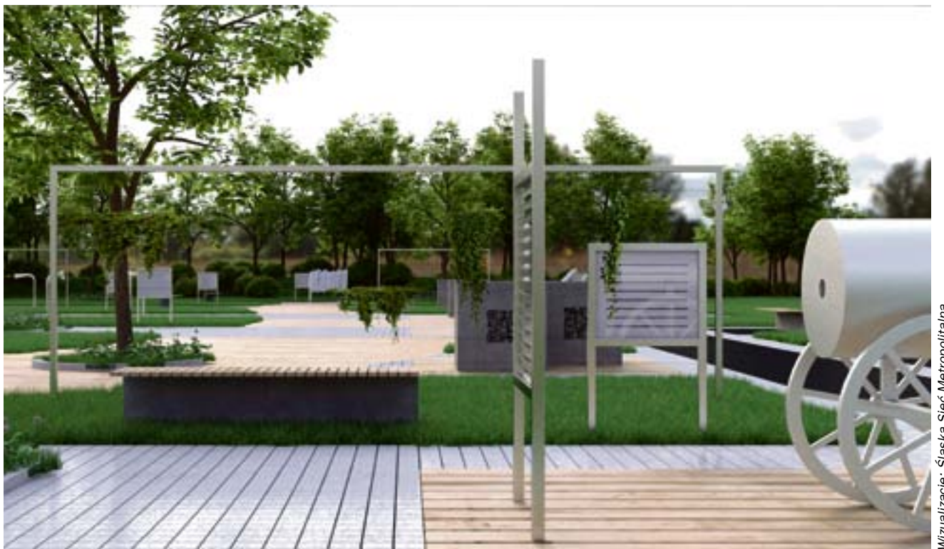
Wizualizacja: Śląska Sieć Metropolitalna

pracami budowlanymi na terenie rekreacyjnym w okolicy samej wieży. Zagospodarowany w tym celu zostanie pas w pobliżu płotu od strony ulicy Lublinieckiej. Sama lokalizacja parku, w pobliżu Radiostacji, nie jest przypadkowa.