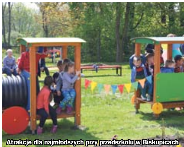
Atrakcje dla najmłodszych przy przedszkolu w Biskupicach