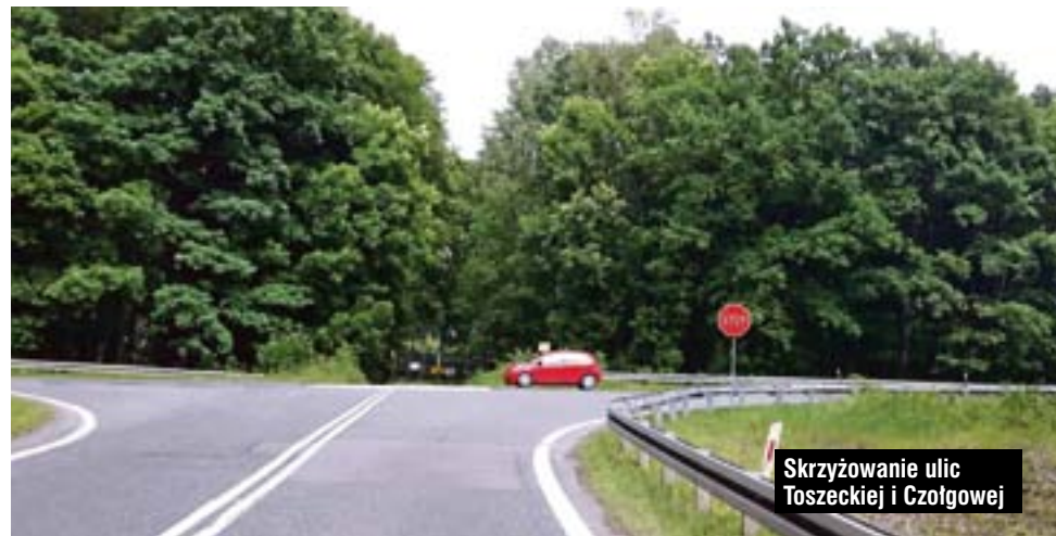
Skrzyżowanie ulic Toszeckiej i Czołgowej