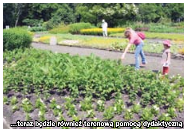
...teraz będzie również terenową pomocą dydaktyczną

umożliwi studentom realizowanie tematów prac licencjackich i magisterskich, pozwoli także korzystać w pełni z bogactwa gatunkowego roślin na terenie ogrodu podczas zajęć terenowych. To już kolejna przestrzeń współpracy Zabrza i Uniwersytetu Śląskiego. 13 czerwca w Zespole Szkół Ogólnokształcących nr 11 zostało podpisane porozumienie o współpracy z Instytutem Historii Uniwersytetu Śląskiego w zakresie współpracy dydaktycznej i naukowo-badawczej. (hm)