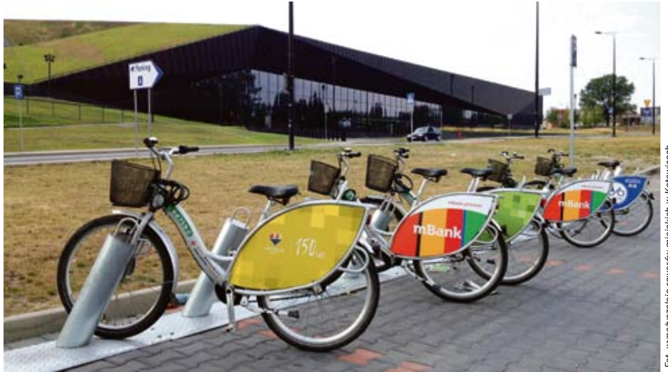
Fot. wypożyczalnia rowerów miejskich w Katowicach

Warto dodać, że pomysł stworzenia miejskiej wypożyczalni rowerów nie jest nowy, jego wprowadzenie planowano już kilka lat temu. Odstąpiono nawet od wykonania przyjętej już przez Radę Miejską uchwały. Opóźnienia tłumaczono m.in. prowadzonymi remontami oraz brakiem sieci