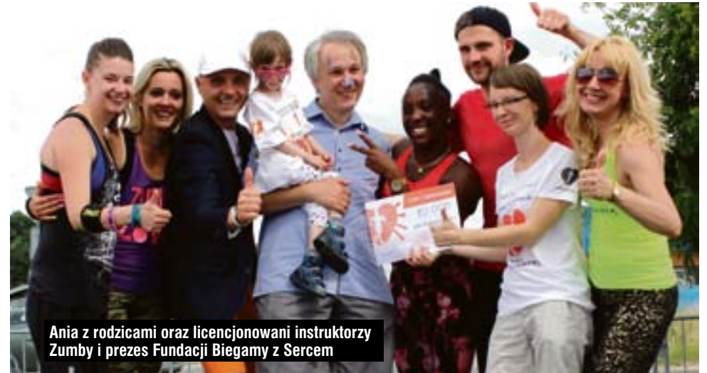
Ania z rodzicami oraz licencjonowani instruktorzy Zumbi i prezes Fundacji Biegamy z Sercem

Szczegóły oraz fotorelacja na www.tanczymzsercem.pl