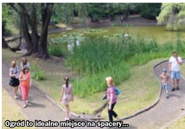
Ogród to idealne miejsce na spacer...