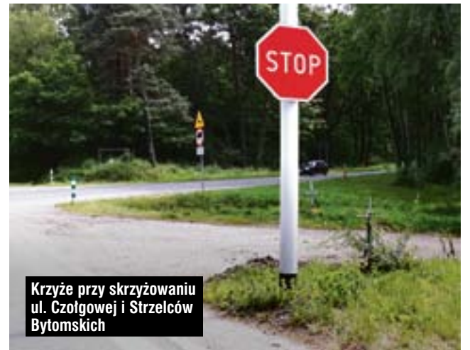
Krzyże przy skrzyżowaniu ul. Czołgowej i Strzelców Bytomskich

Ulica Czołgowa jest szczególnie obciążona przez samochody ciężarowe, które kierują się m.in. w stronę Bumaru i Huty Łabędy, śmiało można ją nazwać obwodnicą Łabęd. Dzięki niej, w centrum tej dzielnicy zmniejszyło się natężenie ruchu samochodowego.