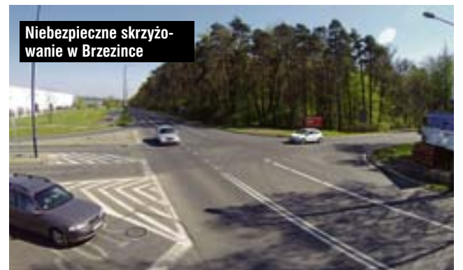
Niebezpieczne skrzyżowanie w Brzezince

Choć wszyscy wiedzą, że powinno tu być rondo, znowu chodzi o pieniądze – wstępnie zadanie zostało wpisane w Wieloletniej Prognozie Finansowej na 2017 rok. Co nie oznacza oczywiście, że nie będzie można go przesunąć na lata kolejne. Oby znów przyspieszyć decyzji urzędników nie musiała czyjaś śmierć.