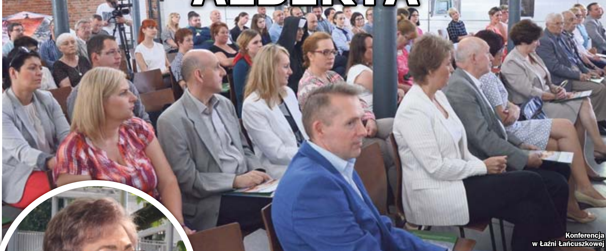
Konferencja w Łaźni Łańcuchówkowej

Pomagają kobietom i dzieciom doświadczającym przemocy. Udzielają wsparcia w wychodzeniu z bezdomności. Organizują zbiórki dla potrzebujących. Zabrzańskie koło Towarzystwa Pomocy im. św. Brata Alberta działa już od 20 lat. W ubiegłym tygodniu świętowało swój jubileusz.