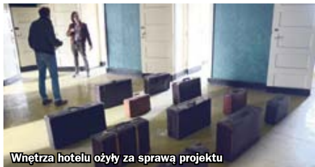
Wnętrza hotelu ożyły za sprawą projektu