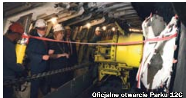
Oficjalne otwarcie Parku 12C