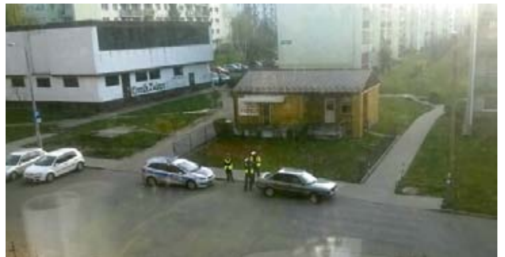
Patrole policji na osiedlu Kopernika