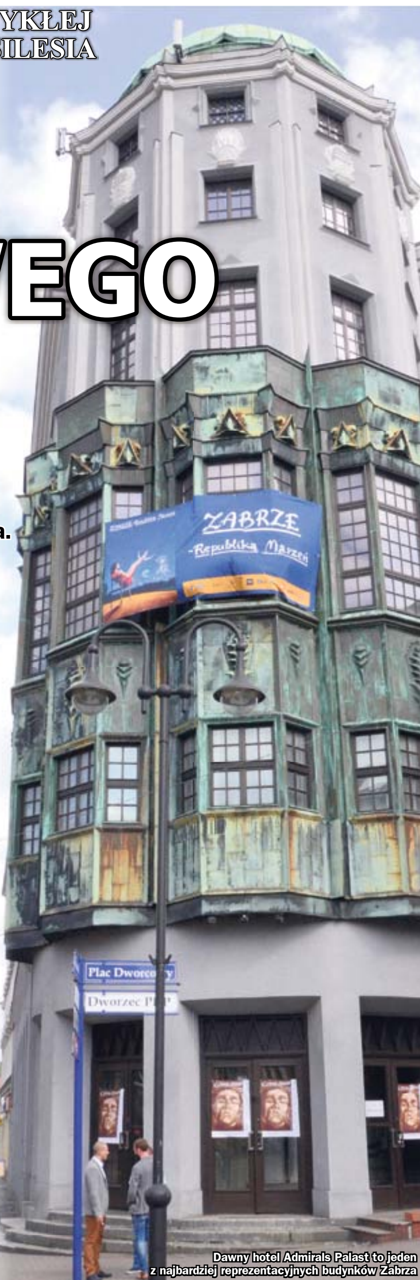
Dawny hotel Admirals Palast to jeden z najbardziej reprezentacyjnych budynków Zabrze