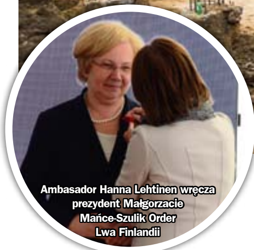
Ambasador Hanna Lehtinen wręcza prezydent Małgorzacie Mańce-Szulik Order Lwa Finlandii

Aż 870 milionów złotych wyda fińska firma Fortum na budowę w Zabrze nowej elektrociepłowni. W poniedziałek wmurowano kamień węgielny pod gigantyczną inwestycję. W uroczystości uczestniczyły minister handlu zagranicznego i rozwoju Finlandii Lenita Toivakka oraz ambasador Finlandii w Polsce Hanna Lehtinen.