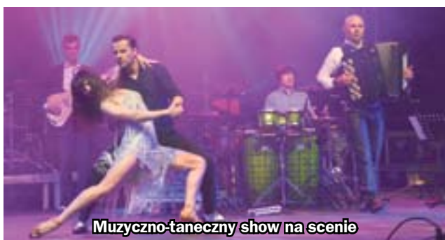
Muzyczno-taneczny show na scenie