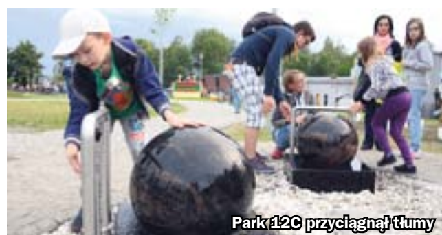
Park 12C przyciągnął tłumy