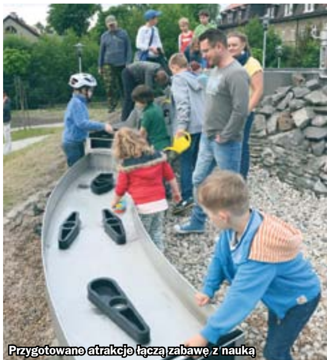
Przygotowane atrakcje łączą zabawę z nauką