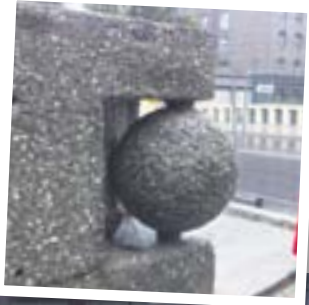
Ozдобne kule zostaną zamontowane pod koniec października