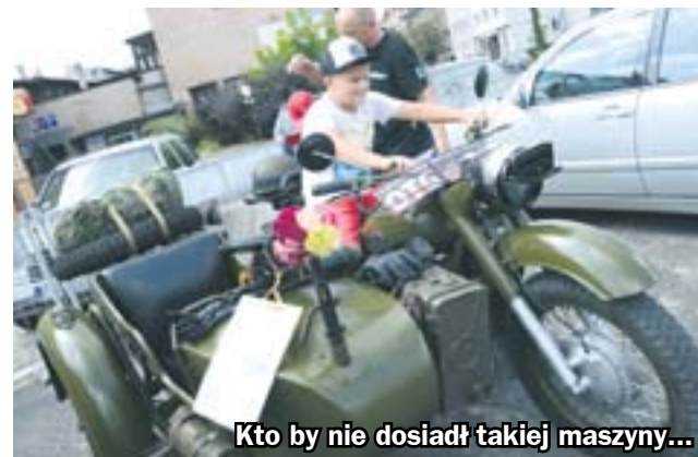
Kto by nie dosiadł takiej maszyny...