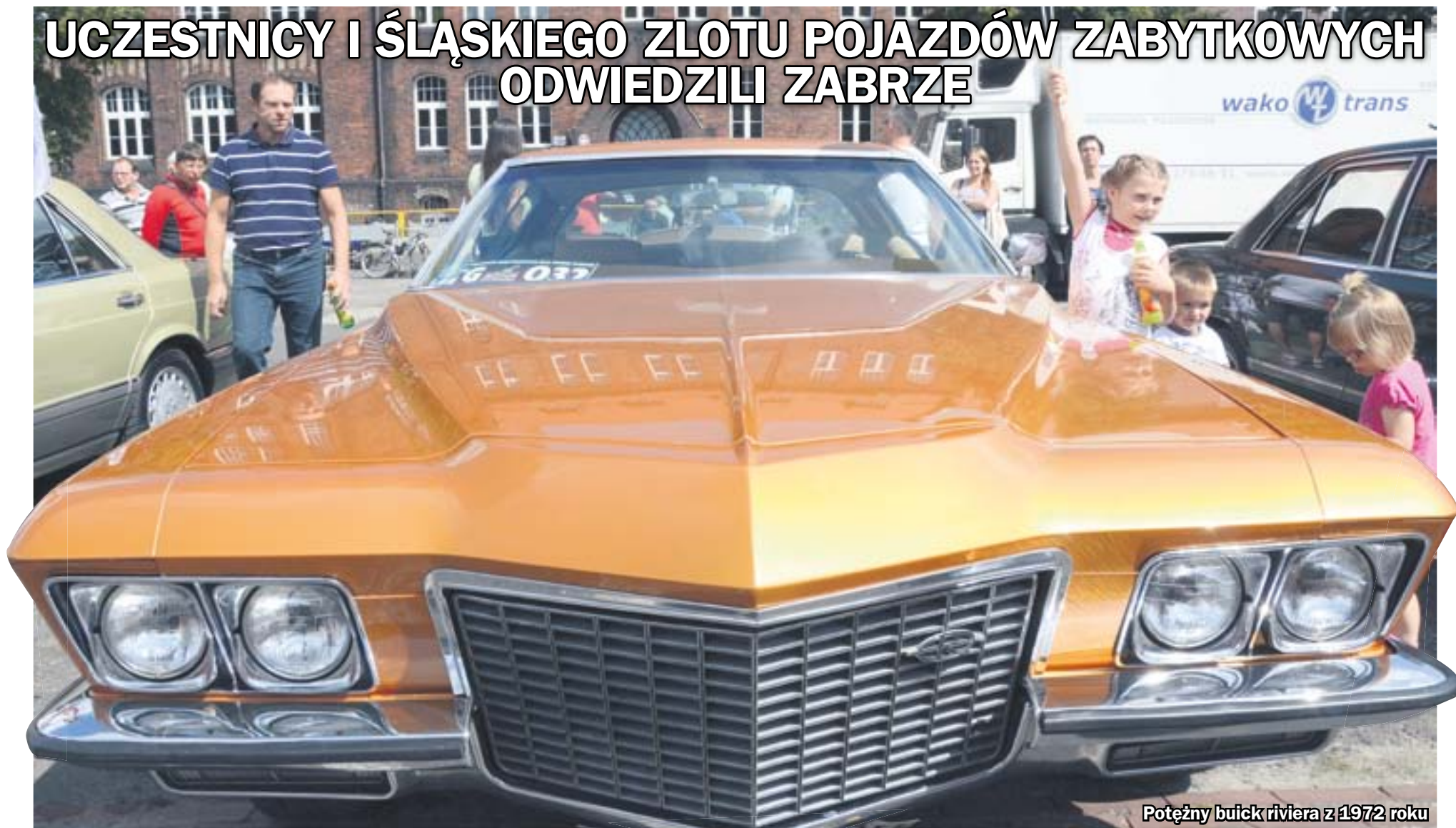
Potężny buick riviera z 1972 roku