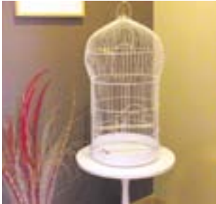
Duża klatka dla ptaków, wys. 80 cm, plus stolik. Używana, 80 zł. Wiadomość w redakcji