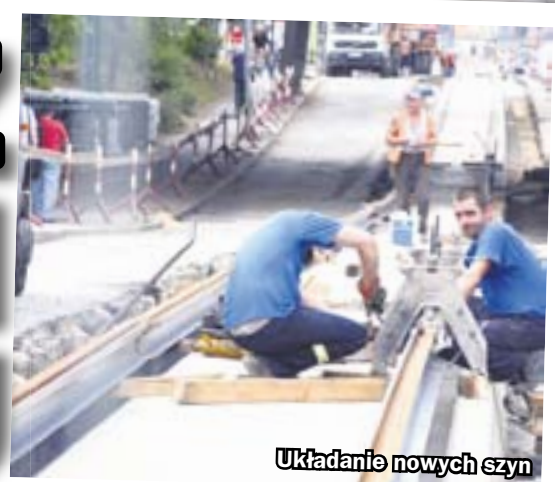
Układanie nowych szyn