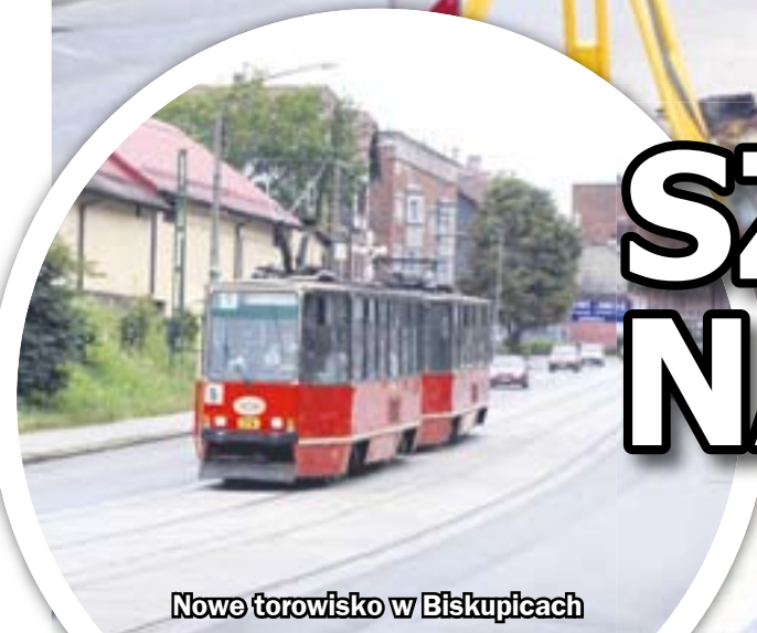
Nowe torowisko w Biskupicach