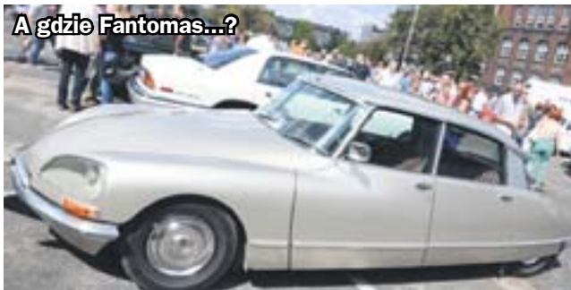
A gdzie Fantomas...?

Był potężny żółt, jakiego przed laty używał Stalin i oklejony... jednogroszówkami pocziwy maluch. W słońcu błyszcząły amerykańskie krążowniki szos i znany z filmów o Fantomasie citroen ds. W sobotę do Zabrze przyjechało ponad sto zabytkowych pojazdów. Wśród nich prawdziwe unikatki.