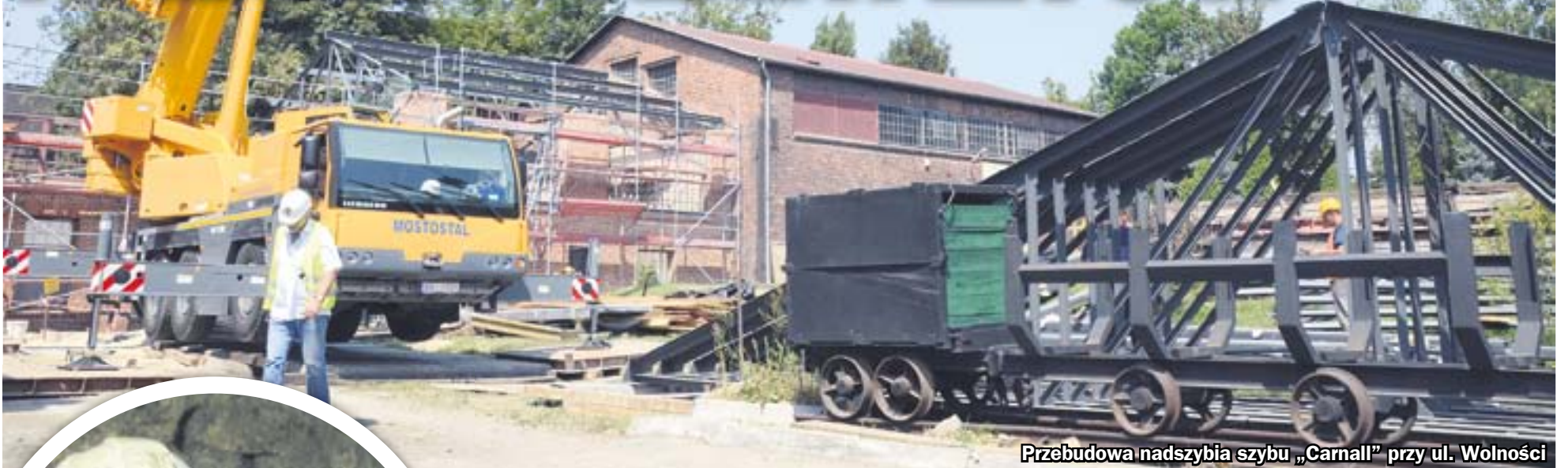
Przebudowa nadszybia szybu „Carnall” przy ul. Wolności

W Głównej Kluczowej Sztolni Dziedzicznej wznovione zostały prace rewitalizacyjne i budowlane. Obecnie udrażniany jest odcinek wyrobiska od strony szybu „Carnall”. Jednocześnie trwają roboty w naziemnej części kompleksu, który już niebawem ma szansę stać się jedną z największych atrakcji na szlaku turystyki przemysłowej w Europie.