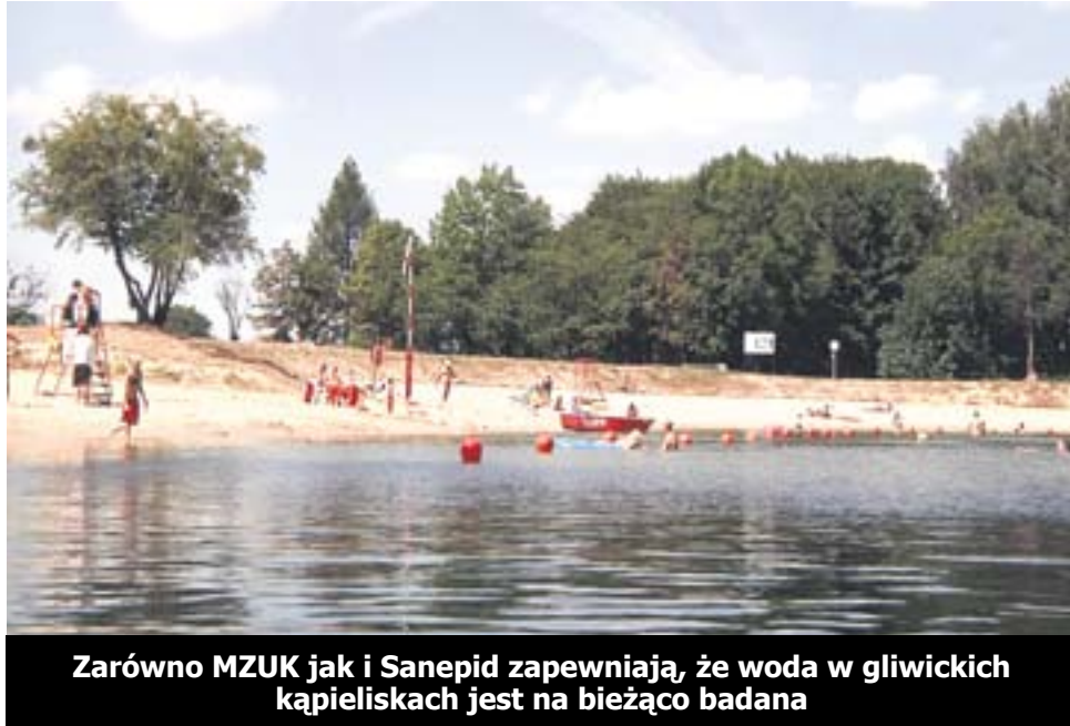
Zarówno MZUK jak i Sanepid zapewniają, że woda w gliwickich kąpieliskach jest na bieżąco badana

– Bada się głównie obecność Escherichia coli (pateczka okrężnicy) w 100 mililitrach, bada się także enterokoki, których powinno być mniej niż 400 w 100