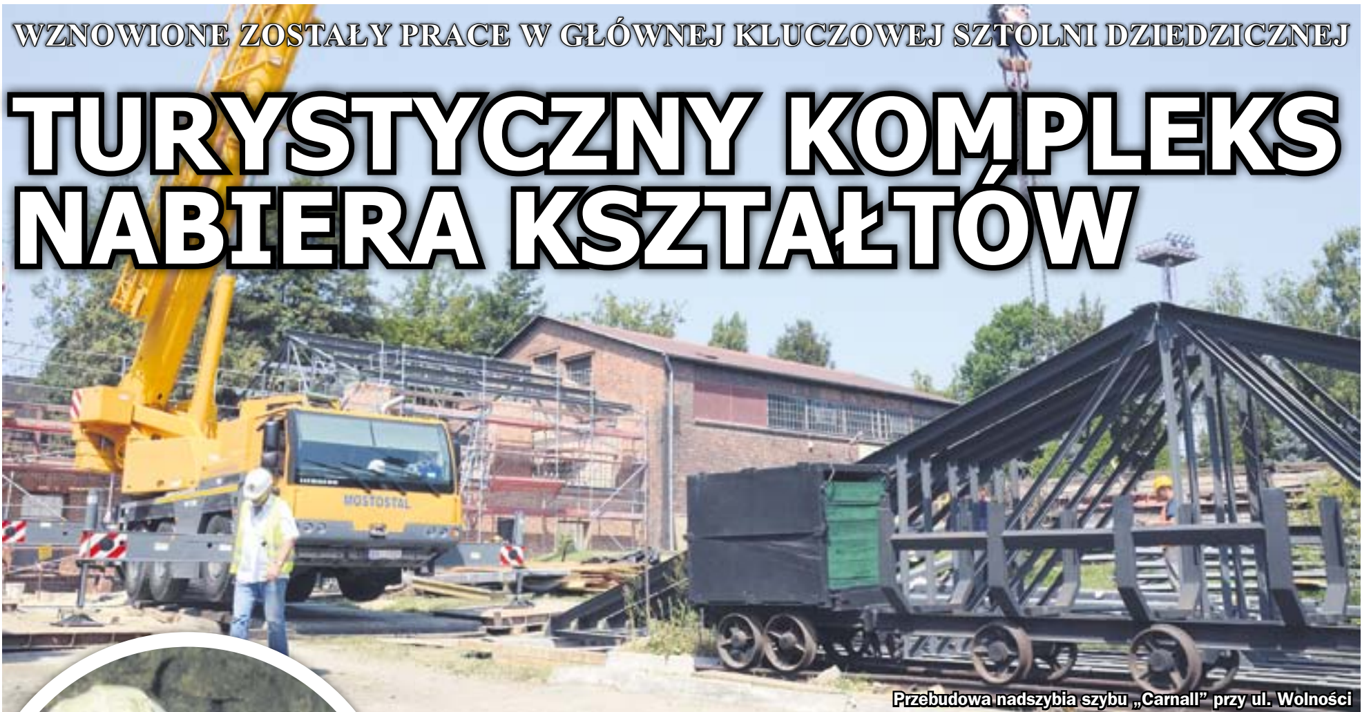
Przebudowa nadszybia szybu „Carnall” przy ul. Wolności

W Głównej Kluczowej Sztolni Dziedzicznej wznowione zostały prace rewitalizacyjne i budowlane. Obecnie udrażniany jest odcinek wyrobiska od strony szybu „Carnall”. Jednocześnie trwają roboty w naziemnej części kompleksu, który już niebawem ma szansę stać się jedną z największych atrakcji na szlaku turystyki przemysłowej w Europie.