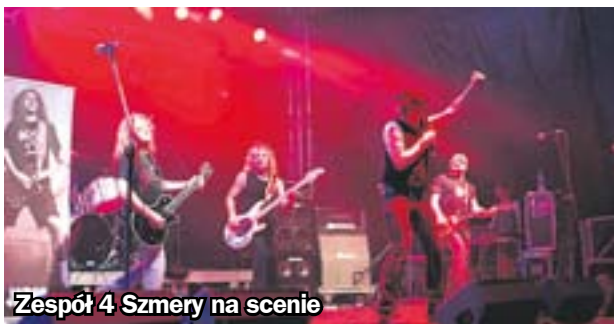
Zespół 4 Szmerzy na scenie

– Zaczęliśmy grać dla przyjemności. Połączyła nas wspólna fascynacja jednym z największych bandów tego świata – AC/DC. Bo można być fanem, ale z czasem,