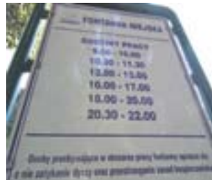
Na tabliczce przy fontannie brak informacji o braku przydatności wody do kąpieli

Latem jak bumerang, powraca temat kąpiel w miejskiej fontannie. Codziennie, szczególnie w trakcie upałów, oblegana jest