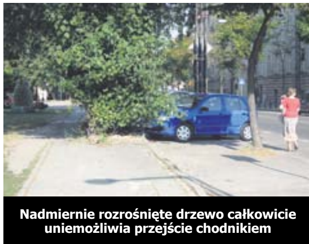
Nadmiernie rozrośnięte drzewo całkowicie uniemożliwia przejście chodnikiem