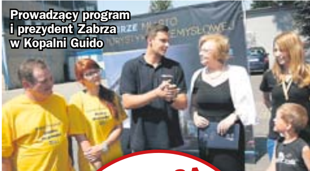
Prowadzący program i prezydent Zabrza w Kopalni Guido