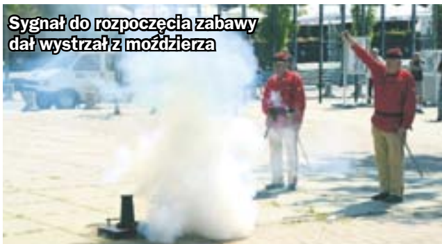
Sygnal do rozpoczęcia zabawy dał wystrzał z moździerza

Zabrzański odcinek programu kręcony był w miejscach, które zmieniły się dzięki funduszom unijnym. Nasza drużyna rywalizowała z Żorami. Uczestnicy zabawy pojawili się w podziemiach Kopalni Guido, na Placu Teatralnym, na dziedzińcu Wydziału Organizacji i Zarządzania oraz w Miejskim Zakładzie Kąpielowym. Emisję programu zaplanowano na 4 listopada o godzinie 19.25 na antenie TVP 3 Katowice. Po emisji każdego odcinka zostanie uruchomione głosowanie SMS-owe dla widzów. Wsparcie uzyskane w ten sposób zostanie wliczone do generalnej punktacji, która zdecyduje o dalszych losach gminy w turnieju. (hm)