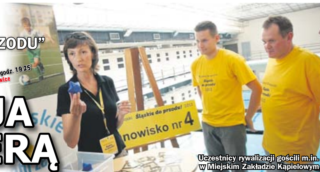
Uczestnicy rywalizacji gościli m.in. w Miejskim Zakładzie Kąpielowym

niePRZEGAPI! 4 listopada, godz. 19.25 TVP 3 Katowice