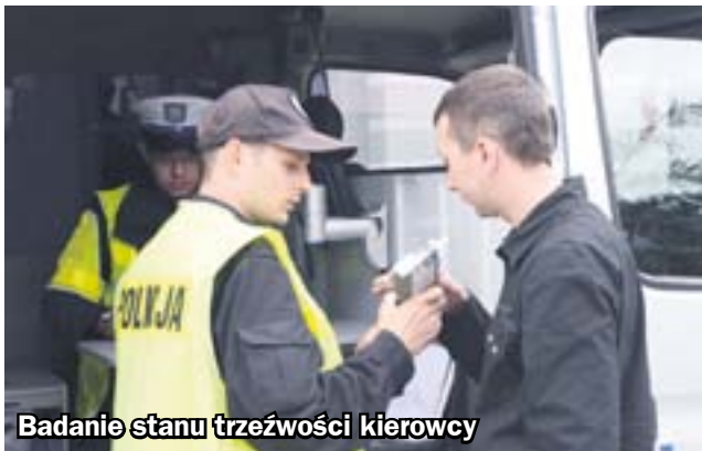
Badanie stanu trzeźwości kierowcy

Ponad 40 autobusów przewożących dzieci i młodzież skontrolowali zabrzańscy policjanci podczas pierwszego miesiąca wakacji. W trzech przypadkach stwierdzili usterki uniemożliwiające dalszą jazdę. Funkcjonariusze przyznają, że stan techniczny autokarów z roku na rok jest coraz lepszy. I jednocześnie apelują, by z prośbą o sprawdzenie pojazdu i jego kierowcy nie czekać na ostatnią chwilę.