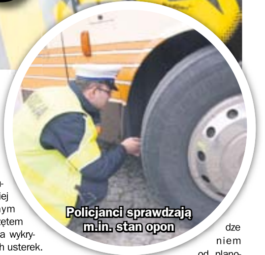
Policjanci sprawdzają m.in. stan opon

Jej funkcjonariusze dysponują nawet bardziej specjalistycznym niż policja sprzętem pozwalającym na wykrycie ewentualnych usterek. Ze Śląskim Wojewódzkim Inspektoratem Transportu Drogowego w Katowicach można się kontaktować telefonicznie pod numerem (32) 42 88 150 lub drogą e-mailową: biuro@katowice.witd.gov.pl . – Z uwagi na znaczącą liczbę zgłoszeń prosimy o ich przesłanie z okolo tygodniowym wyprze-