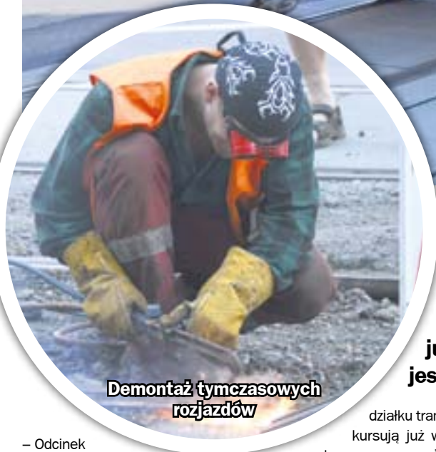
Demontaż tymczasowych rozjazdów