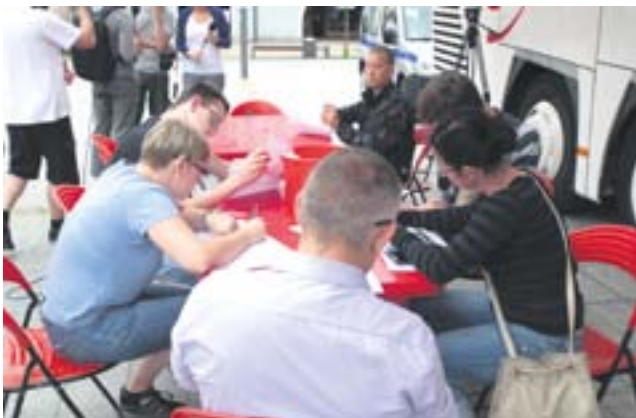
Podczas wtorkowej akcji krew oddało 49 osób