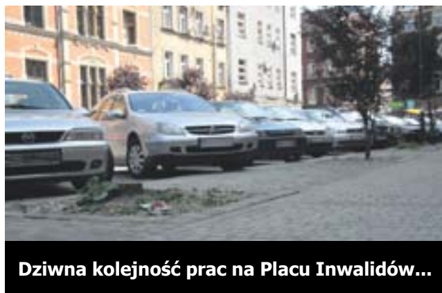
Dziwna kolejność prac na Placu Inwalidów...

Pan Ryszard zwrócił uwagę na dziwną kolejność prac remontowych przy Placu Inwalidów w Gliwicach.