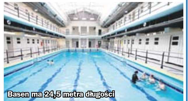
Basen ma 24,5 metra długości

Budynek łaźni miejskiej, w którym działa obecny Miejski Zakład Kąpielowy, powstał w latach 1927-29. Goście obiektu mogą korzystać z basenu o wymiarach 24,5 na 10 metrów, sali gimnastycznej, biczu szkockich i saun. Warta odwiedzenia jest pomagająca w leczeniu schorzeń górnych dróg oddechowych grota solna. W ostatnich latach budynek przeszedł gruntowną moder-