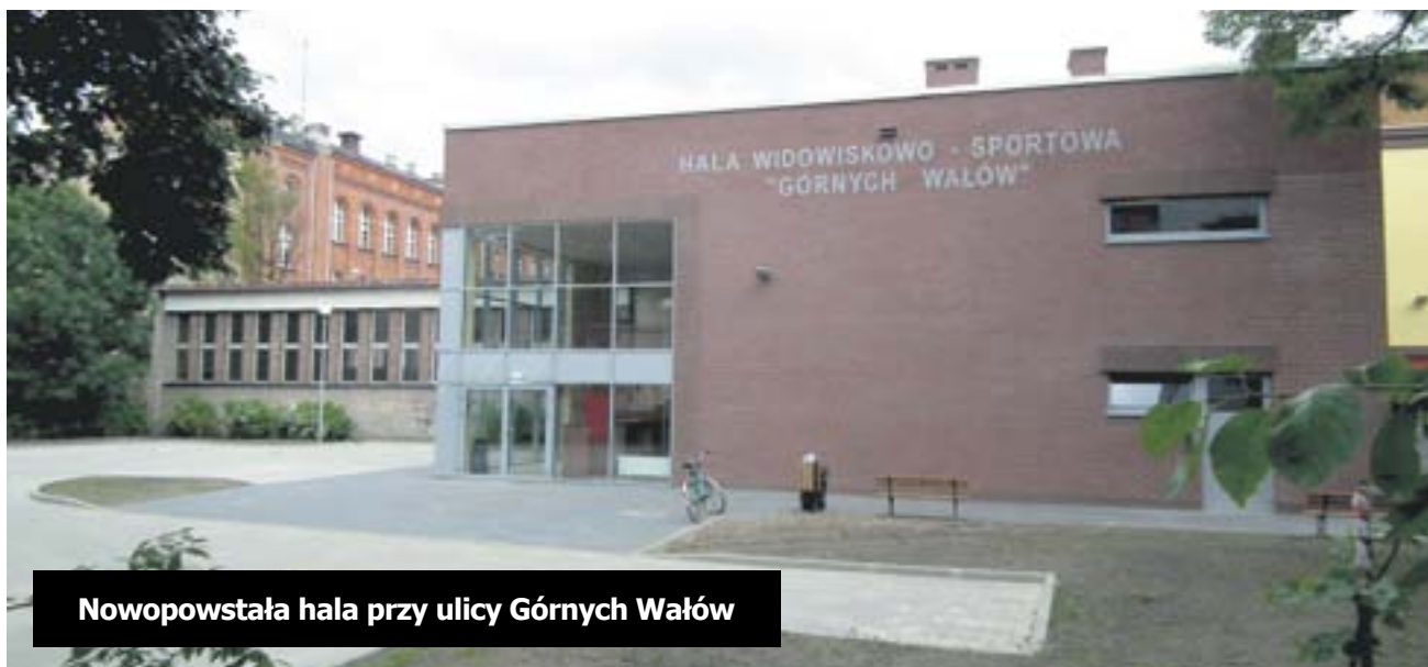
Nowopowstała hala przy ulicy Górnich Wałów