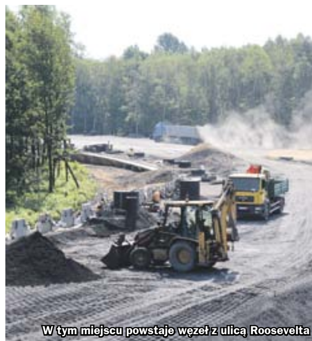
W tym miejscu powstaje węzeł z ulicą Roosevelta

Rafał Zasowski uspokaja, że kłopoty z dopięciem finansowania inwestycji nie wpłynęły w żaden sposób na tempo prac w Zabrzu. – Roboty postępują zgodnie z planem – podsumowuje Rafał Zasowski. (hm)