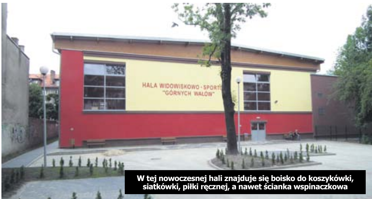
W tej nowoczesnej hali znajduje się boisko do koszykówki, siatkówki, piłki ręcznej, a nawet ścianka wspinaczkowa

Gotowe są dwie z czterech budowanych w Gliwicach hal sportowych. Pierwszy z obiektów powstał przy Zespole Szkół Ogólnokształcących nr 11 przy ul. Górnich Wałów. Koszt jego powstania to prawie 9 mln zł. Podobna do niej, również już gotowa, jest hala przy ul. Kozielskiej, z której skorzystają m.in. uczniowie Zespołu Szkół Ekonomiczno-Usługowych i Zespołu Szkół Ogólnokształcących nr 1.