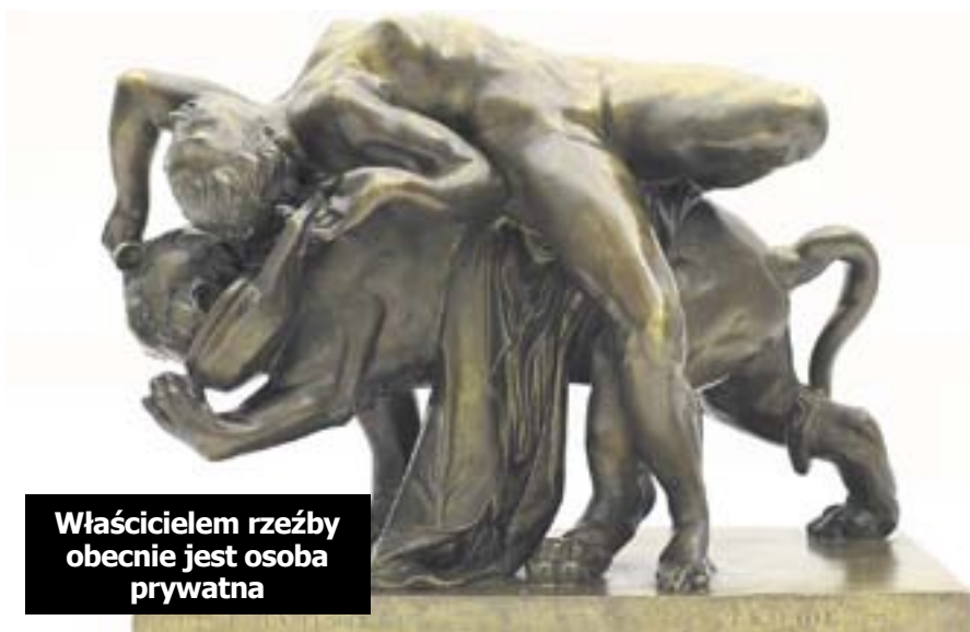
Właścicielem rzeźby obecnie jest osoba prywatna