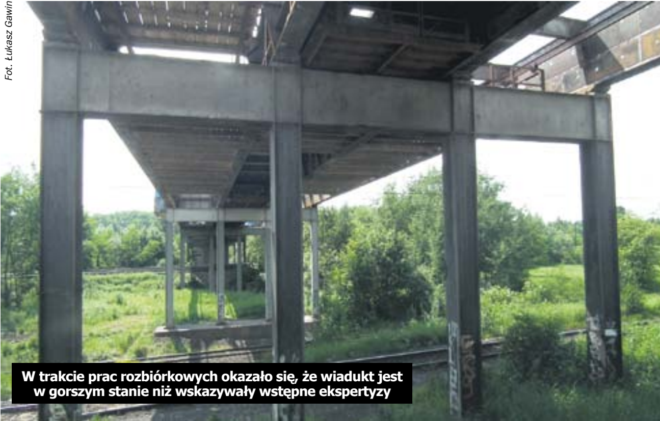
W trakcie prac rozbiórkowych okazało się, że wiadukt jest w gorszym stanie niż wskazywały wstępne ekspertyzy