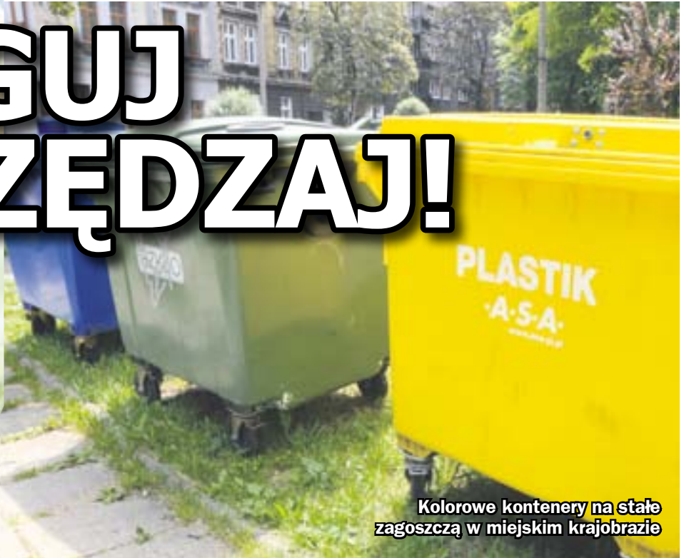
Kolorowe kontenery na stałe zagospodarują w miejskim krajobrazie

Po zgnieceniu plastikowe opakowania zajmują znacznie mniej miejsca