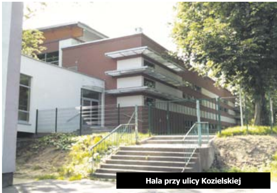
Hala przy ulicy Kozielskiej

W halach będą prowadzone nie tylko zajęcia szkolne ale także zawody w różnych dyscyplinach m.in.: koszykówki, siatkówki czy piłki ręcznej, jak również widowiska i imprezy estradowe. W hali przy ul. Górnich Wałów dodatkowo znajduje się ścianka wspinaczkowa, a na widowni może usiąść 157 osób. Pierwszą z inwestycji, przy ul. Górnich Wałów, zrealizowała firma DOMBUD, drugą, przy ul. Kozielskiej – firma KARTEL. Prace budowlane rozpoczęły się w ubiegłym roku.