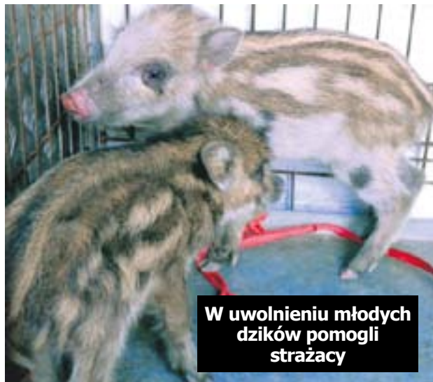
W uwolnieniu młodych dzików pomogli strażacy