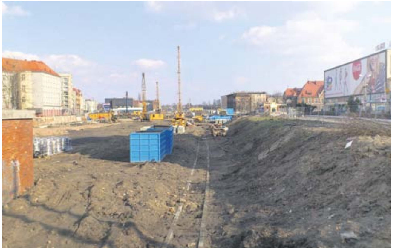
Wiele wskazuje na to, że to koniec zawirowań wokół „średnicówki”

Jak zaznaczył Mirosław Sekuła , marszałek województwa,