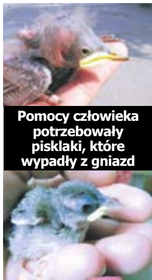
Pomocy człowieka potrzebowały pisklaki, które wypadły z gniazd