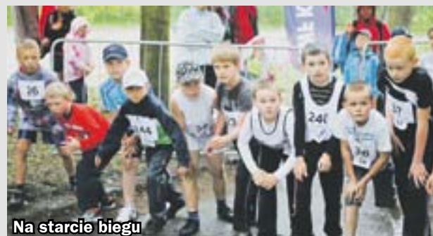
Na starcie biegu