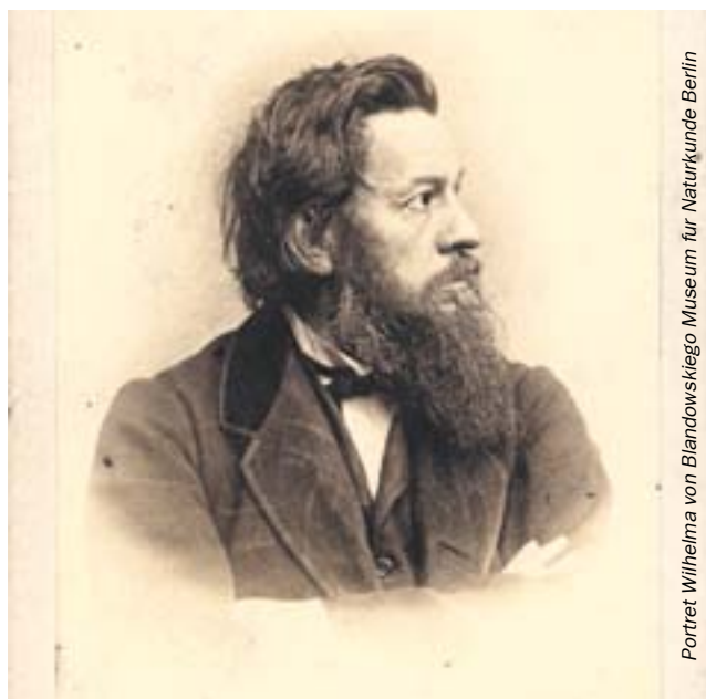
Portret Wilhelma von Blandowskiego. Museum für Naturkunde Berlin

Jego żywot to trochę żywot szaleńca, ale dzięki niemu możemy teraz przenieść się w czasie o 150 lat. O kim mowa? O Wilhelmie von Blandowskim - znakomitym gliwickim fotografie i... kontrowersyjnym, ekscentrycznym człowieku. Wystawę jego zdjęć można już oglądać w Czytelnicy Sztuki w Gliwicach, przy ul. Dolnych Wałów 8a.