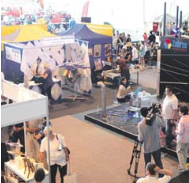
Targi organizowane są w hali MOSiR

PRZED NAMI V MIĘDZYNARODOWE TARGI TURYSTYKI DZIEDZICTWA PRZEMYSŁOWEGO I TURYSTYKI PODZIEMNEJ