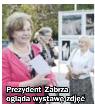
Prezydent Zabrze ogląda wystawę zdjęć

Inauguracji MŚR towarzyszyło otwarcie przed Domem Muzyki i Tańca plenerowej wystawy zdjęć