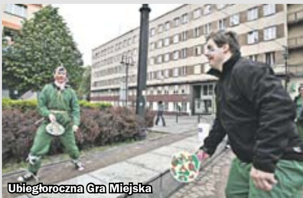
Ubiegłoroczna Gra Miejska

Lot balonem nad Śląskiem czeka na zwycięzców Gry Miejskiej, która towarzyszyć będzie pierwszemu dniu targów. W tym roku zabawę przygotowano pod hasłem „Nakręć się na Zabrze!”. Podstawą rywalizacji jest lista, na której znajdują się różnego rodzaju zadania. W ubiegłym roku znalazło się wśród nich m.in. paradowanie po mieście we własnoręcznie wykonanym stroju obcego, gra w kosmicznego badmintona czy zdobycie czegoś