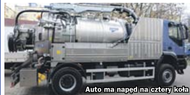
Auto ma napęd na cztery koła

Nie powstrzymają go żadne wertepy, a potężna moc pozwala mu na pompowanie osadu nawet z głębokości dwunastu metrów. Zabrzeńskie Przedsiębiorstwo Wodociągów i Kanalizacji od kilku dni ma do dyspozycji supernowoczesny samochód do ciśnieniowego mycia kanałów.