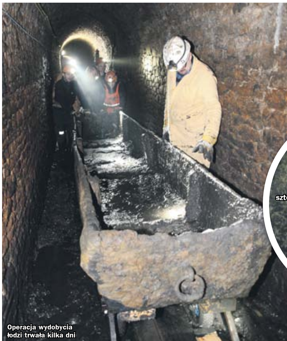
Operacja wydobywania łodzi trwała kilka dni

ZNALEZISKO ZE SZTOLNI PODDAWANE JEST ZABIEGOM KONSERWATORSKIM