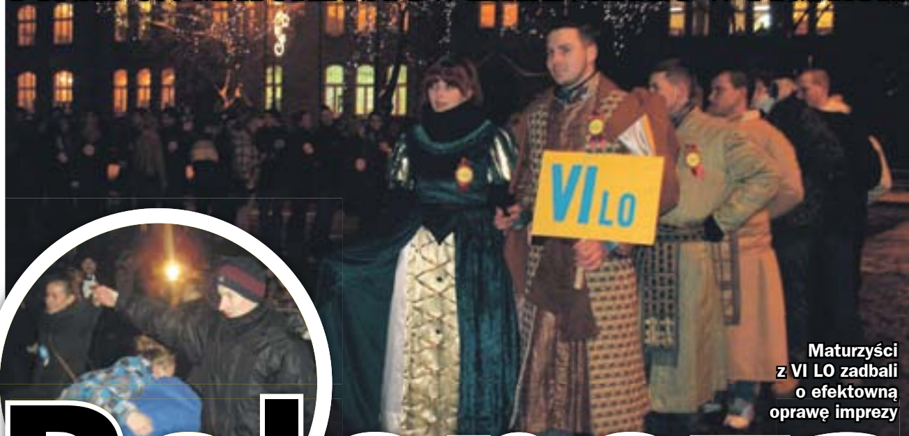
Maturzyści z VI LO zadbali o efektowną oprawę imprezy

PONAD 600 MATURZYSTÓW ZATAŃCZYŁO W TYM ROKU NA PLACU WARSZAWSKIM