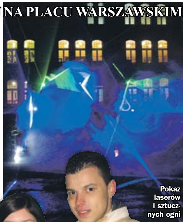
Pokaz laserów i sztucznych ognii