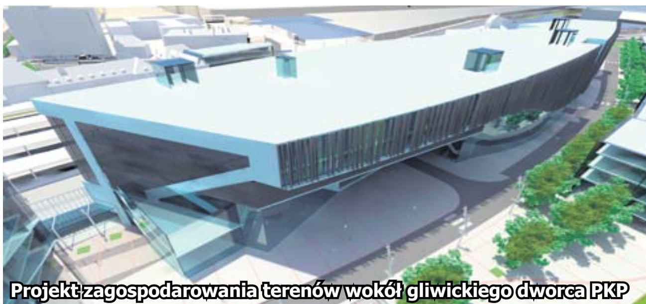
Projekt zagospodarowania terenów wokół gliwickiego dworca PKP

Mierzący 4,70 metra długości kabriolet, do sprzedaży trafi za kilka miesięcy. Choć wygląd auta to rzecz gustu, większość z nas jest zgodna – to najpiękniejszy model, jaki będzie (przynajmniej na razie) opuszczać progi gliwickiej fabryki.