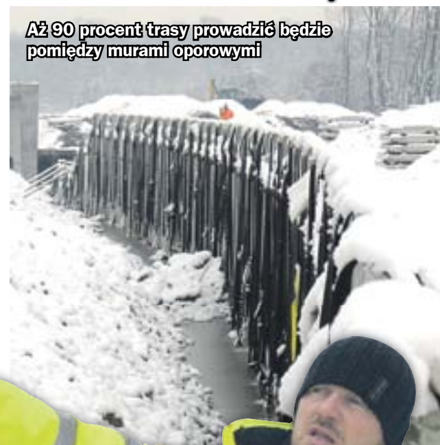
Aż 90 procent trasy prowadzić będzie pomiędzy murami oporowymi