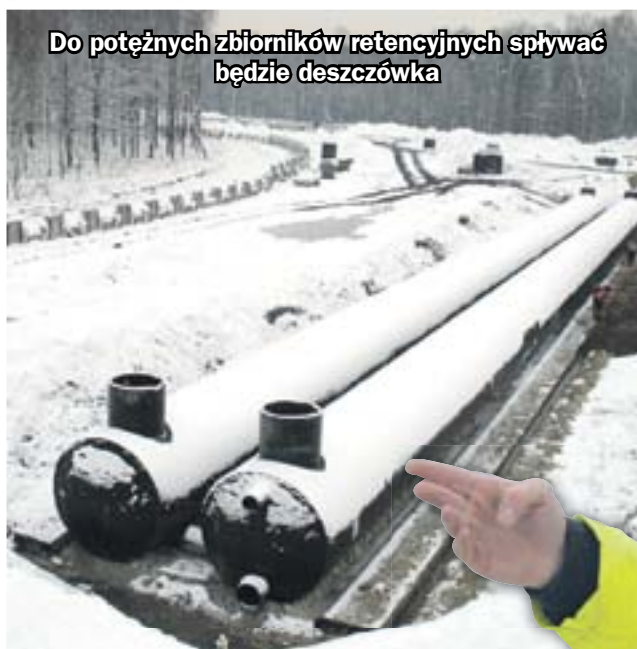
Do potężnych zbiorników retencyjnych spływać będzie deszczówka