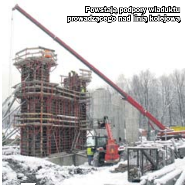
Powstają podpory wiaduktu prowadzącego nad linią kolejową