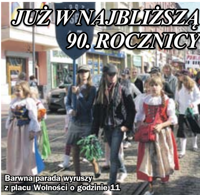
Barwna parada wyruszy z placu Wolności o godzinie 11.