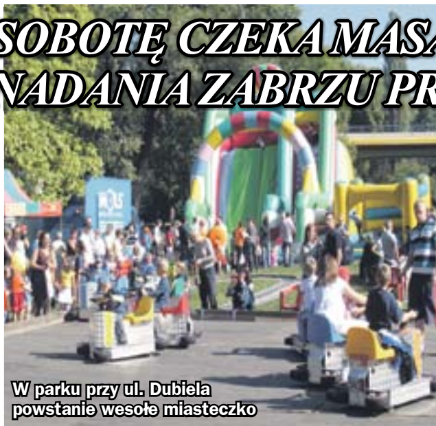
W parku przy ul. Dubiela powstanie wesołe miasteczko