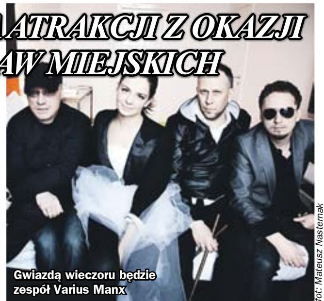
Gwiazdą wieczoru będzie zespół Varius Manx