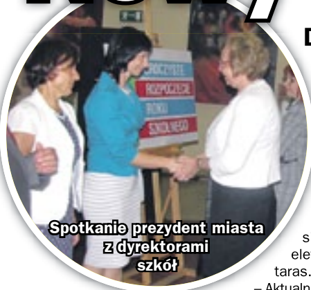
Spotkanie prezydent miasta z dyrektorami szkół

sistów. Wśród nich jest ponad 250 sześciolatków. Łącznie w szkołach podstawowych zdobywać wiedzę będzie w tym roku 9,2 tysiąca uczniów. W Zabrze mamy aktualnie 5,2 tysiąca gimnazjalistów i 5,8 tysiąca uczniów szkół ponadgimnazjalnych. Opieką przedszkolną objęto z kolei 4,5 tysiąca maluchów. (hm)