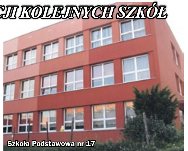
Szkoła Podstawowa nr 17