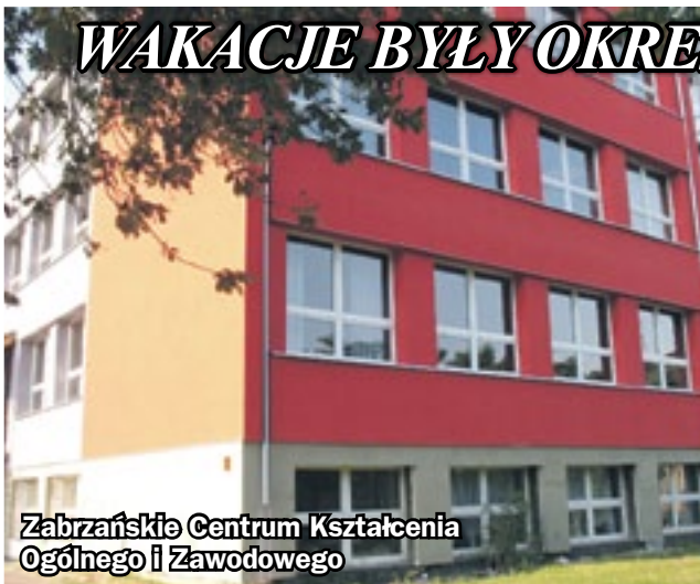
Zabrzeńskie Centrum Kształcenia Ogólnego i Zawodowego