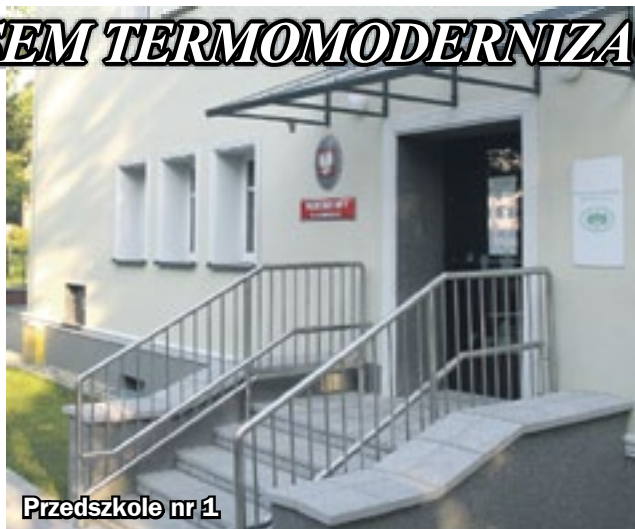
Przedszkole nr 1