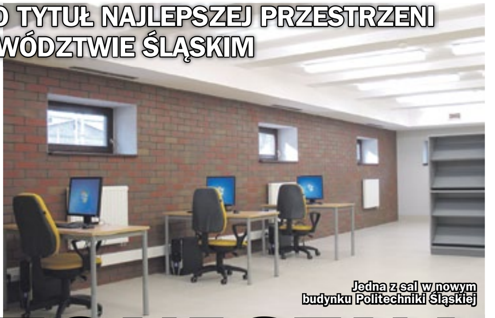
Jedna z sal w nowym budynku Politechniki Śląskiej