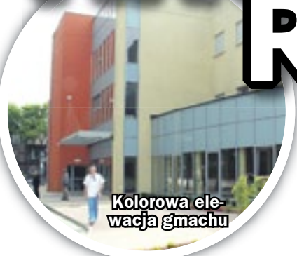
Kolorowa elewacja gmachu

Do końca sierpnia można jeszcze głosować w konkursie na najlepszą przestrzeń publiczną województwa śląskiego. W rywalizacji o zaszczytny tytuł biorą udział dwa obiekty z Zabrze. Chodzi o nowe gmachy Wydziału Organizacji i Zarządzania Politechniki Śląskiej oraz Śląskiego Centrum Chorób Serca.