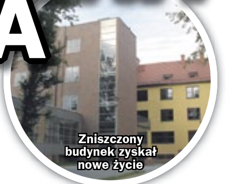
Zniszczony budynek zyskał nowe życie

Konkurs „Najlepsza Przestrzeń Publiczna Województwa Śląskiego” organizowany jest przez Zarząd Województwa Śląskiego. Do tegorocznej, 13. już edycji zgłoszono 43 obiekty. Wśród dwóch zabrzańskich propozycji jest nowy budynek Wydziału Organizacji i Zarządzania Politechniki Śląskiej. Do gruntownie przebudowanych dawnych koszar wojskowych studenci i wykładow-