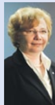
Małgorzata Mańka-Szulik, prezydent Zabrza

Wszystkie z ośmiu kontraktów na roboty budowlane w ramach drugiego etapu poprawy gospodarki wodno-ściekowej w Zabrze zostały już zawarte. Zaplanowane na najbliższe tygodnie spotkania informacyjne z mieszkańcami będą doskonałą okazją, by poznać zakres prac w dzielnicach i porozmawiać z wykonawcami robót w ramach poszczególnych kontraktów. Zachęcam do udziału w spotkaniach i dyskusji na temat inwestycji.