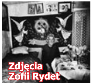
Zdjęcia Zofii Rydet

Czytelnia Sztuki Gliwice, ul. Dolnych Wałów 8a, tel. 32 231-08-54 • wystawa Zdjęcia Zofii Rydet.