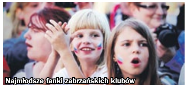
Najmłodsze fanki zabrzańskich klubów