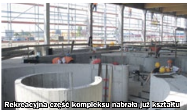
Rekreacyjna część kompleksu nabrała już kształtu

powietrzny i grota sztucznej fali. Do dyspozycji będą sauny, natryski wrażeń, bicz wodne, misy do moczenia stóp, basenik schładzający z zimną wodą oraz aneks wypoczynkowy. Przy kompleksie powstanie 130 miejsc parkingowych. (hm)