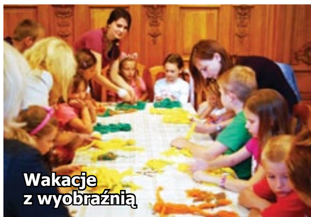
Wakacje z wyobraźnią

m.in. Wełnianego Przyjaciela, który jest miękki i nigdy się nie skarży, więc zawsze można się do niego przytulić, Papierowego Psa i Sowę Mądrą Głowę, na której brzuszku znajduje się miejsce na wrześnieowy plan lekcji. Bo to przecież mit,