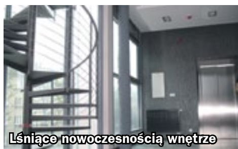
Łśniące nowoczesnością wnętrze