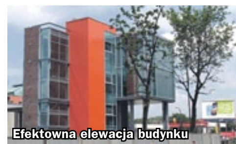
Efektowna elewacja budynku