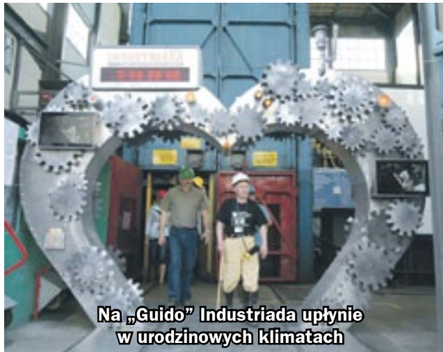
Na „Guido” Industriada upłynie w urodzinowych klimatach