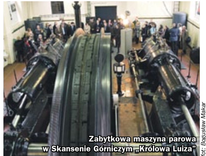
Zabytkowa maszyna parowa w Skansenie Górniczym „Królowa Luiza”