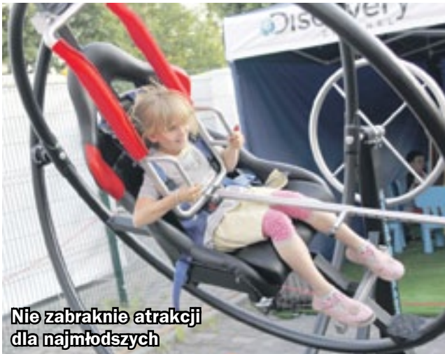
Nie zabraknie atrakcji dla najmłodszych

Świątująca 5. urodziny kopalnia „Guido”, Muzeum Górnictwa Węglowego i Szyb Maciej zapraszają na Industriadę