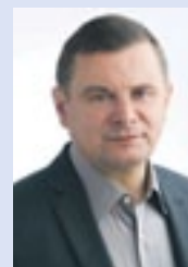
Jerzy Polaczek, poseł PiS

Ostatnie lata są dobre dla Drogowej Trasy Średnicowej i jestem przekonany, że kolejne również takie będą. Budowa średnicówki jest dla aglomeracji równie istotna, jak rozbudowa sieci autostrad dla kraju. Jako inwestycja na styku budżetu centralnego i samorządu, ma ten plus, że jest tu na miejscu koordynowana i pilnowana. Myślę, że dotychczasowe dobre doświadczenia zabrzańskie sprawią, że budowa następnych odcinków będzie postępować równie sprawnie.