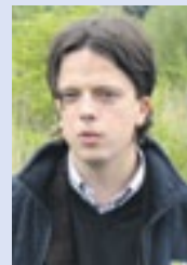
Tomasz Głogowski, poseł PO