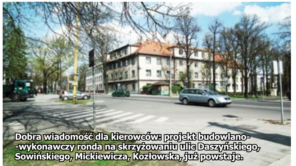
Dobra wiadomość dla kierowców: projekt budowlano-wykonawczy ronda na skrzyżowaniu ulic Daszyńskiego, Sowińskiego, Mickiewicza, Kozłowska, już powstaje.