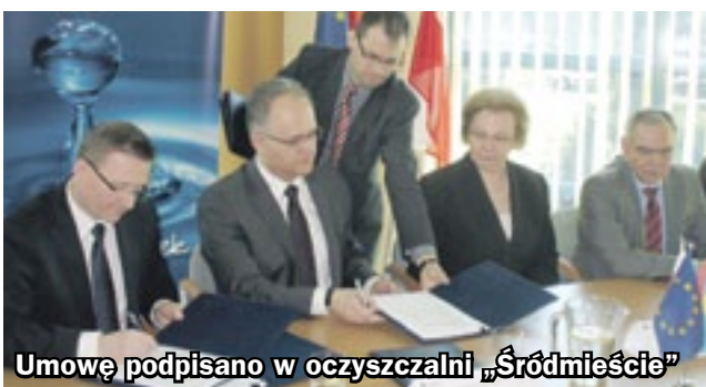
Umowę podpisano w oczyszczalni „Śródmieście”