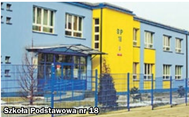
Szkoła Podstawowa nr 18