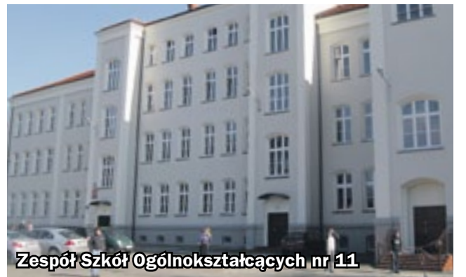
Zespół Szkół Ogólnokształcących nr 11