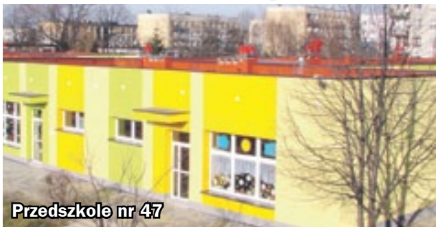
Przedszkole nr 47