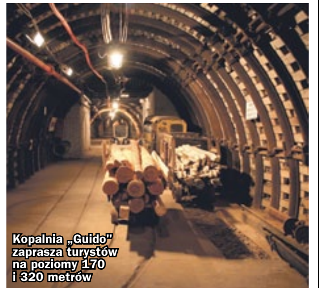
Kopalnia „Guido” zaprasza turystów na poziomy 170 i 320 metrów

Zwiedzanie obu obiektów wymaga wcześniejszej rezerwacji. Wstęp do Tyskiego Browarium mają tylko osoby pełnoletnie. Dodatkowe informacje można znaleźć na stronach internetowych www.kopalniaguido.pl oraz www.tyskiebrowarium.com.pl . (hm)